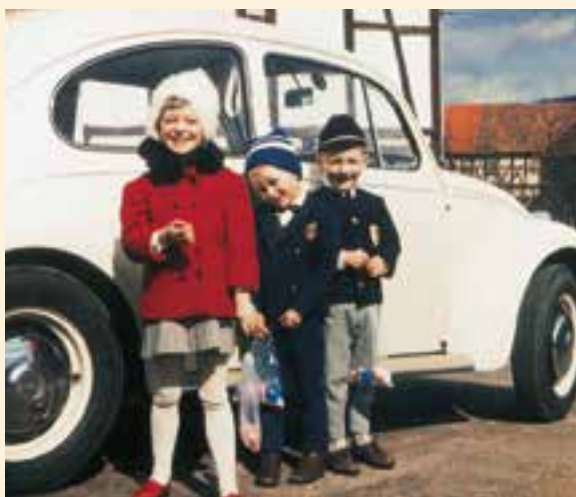
Papas Stolz: Der Wagen und die Kinder

Dem Boxsport haftete 1964 ein eher verruchtes Image an. Der amerikanische Schwergewichtler Cassius Clay (*1942) änderte das. Sein eleganter Stil und sein großes Mundwerk trieben auch die vor die Fernseher, die sich bisher nicht fürs Boxen interessiert hatten. Als Amateur wurde Clay 1960 Olympiasieger, 1964 wurde er der bislang jüngste Boxweltmeister. 1965 trat er als Muhammad Ali der militanten Farbigenbewegung der Black Muslims bei. Weil er sich weigerte am Vietnamkrieg teilzunehmen, entzogen ihm die Boxverbände im Mai 1967 den Weltmeistertitel. „They never come back“, lautete eine eiserne Regel des Boxsports. Muhammad Ali durchbrach sie. Er kehrte auf die Box-Bühne zurück und holte sich 1974 den Weltmeistertitel im Kampf gegen George Foreman. 1980 endete seine Karriere. Muhammad Ali ist heute schwer krank. Er leidet an Parkinson, einer Krankheit des vegetativen Nervensystems.