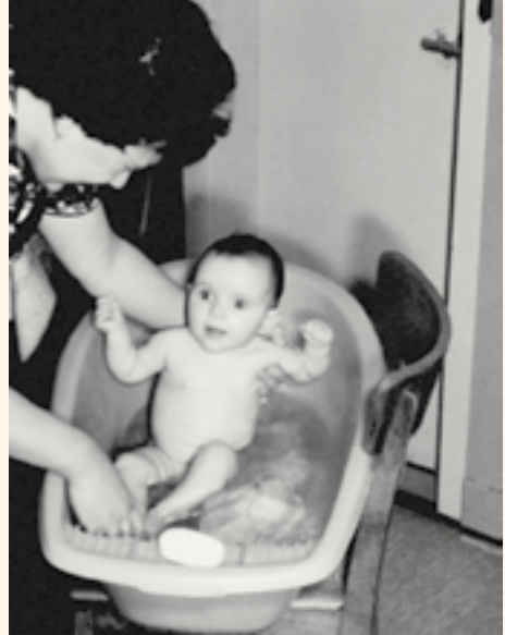
Wenig Komfort, viel Spaß: Baden in der Wanne auf dem Küchenstuhl

Hin- und Rückspielen von 16 Profimannschaften als Meister hervor. Das Fußball-Fieber griff um sich. Musste man vorher am Kofferradio sitzen, um die Ergebnisse zu hören, konnte man in den 60ern aufs Fernsehen umsteigen und sehen, was vorher nur zu hören gewesen war. Wer den Anpfiff nicht verpassen wollte, musste seinen Apparat früh einschalten: Die Bildröhre brauchte ewig, um in die Pötte zu kommen und ein einigermaßen klares, wenn auch nur schwarz-weißes Bild zu zaubern. Die Freizeitgesellschaft war noch nicht erfunden. Fußball und Vereine: Das waren die größten Freizeitangebote.