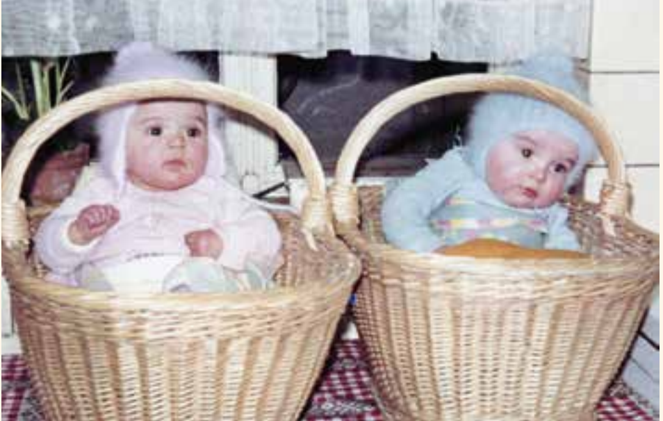
Aktion Sicheres Sitzen: Wenn kein Laufstall in der Nähe war, tat es auch mal der Einkaufskorb

wurde es um Brust und Arme gelegt, die Erwachsenen hielten die beiden Lederriemen fest. Wer nach vorne fiel, wurde aufgefangen. Wer nach hinten kippte, hatte schlicht Pech.