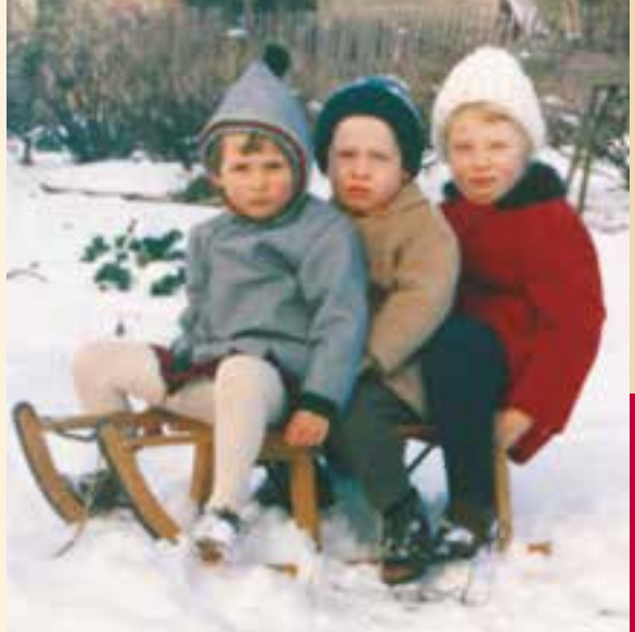
Warm, aber kratzig: Das Fleece war in den 60ern noch nicht erfunden

Überhaupt wurde in der Kleiderfrage strikt nach Werktags- und Sonntagskleidung unterschieden. Da aber die Werkstage von ihrer Zahl her den Sonntagen weit überlegen waren, hätte man eigentlich sechsmal mehr Alltags- als Sonntagskleider gebraucht. Diesen Gedanken hat damals anscheinend niemand zu Ende gedacht. Der Schrank quoll meist über von Kleidern und Hemden, die immer viel zu gut zum Anziehen waren. So wie die schönen Lackschuhe oder der Matrosenanzug. Sachen, die man höchstens dann tragen durfte, wenn man auf einer Hochzeit Blumen streuen sollte. Nach der