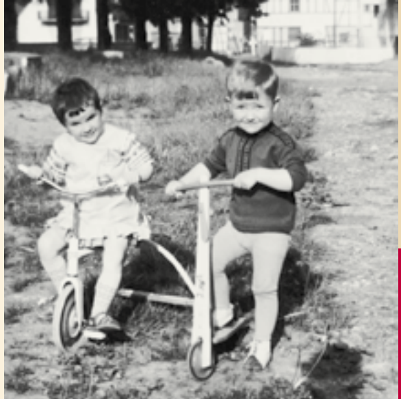
Viele Kinder, kaum Verkehr: Wir waren mit klapprigen Gefährten auf holprigen Straßen unterwegs

In den USA hat die Kindersendung Sesamstraße Premiere.