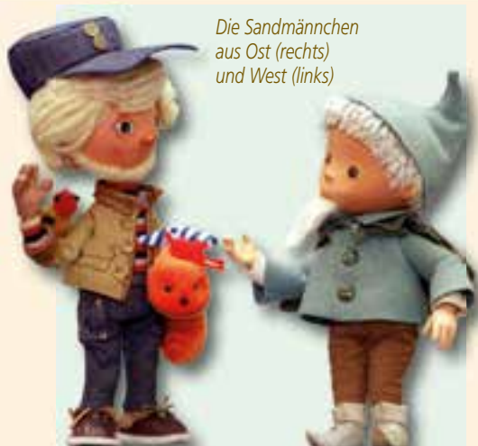
Die Sandmännchen aus Ost (rechts) und West (links)