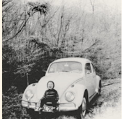
Ganzer Stolz: Der Sohn und das Auto

Der Begriff Zone war geläufig, das Wort Stau allerdings noch nicht. Die Autofahrer hätten sich Anfang der 60er noch immer per Handschlag begrüßen können, so selten waren sie auf den ländlichen Straßen anzutreffen. In den Städten sah das anders aus, doch auf dem platten Land