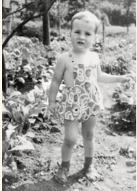
Praktisch: Der eigene Garten war der Obst- und Gemüselieferant

Als Nachtisch gab es das für die Ewigkeit eingeweckte Obst. Das hatte meist die Halbwertzeit von vielen hundert Jahren und bot damit keine Gefahr zu verderben. Nach beinahe jedem Mittagessen standen Einlitergläser voller Kirschen oder Birnen auf dem Tisch. Die Kirschen aber waren ein zweischneidiges Schwert. Die waren lecker, aber oft schon längst von Würmern besetzt. Wenn der luftdicht verschlossene Deckel geöffnet wurde, suchten wir fieberhaft das Glas nach den Wurmleichen ab. Die lagen immer auf dem Grund und verdarben einem am Schluss den ganzen Spaß am Nachtisch. Vor allem, wenn man sie erst dann entdeckte, nachdem man schon alle Kirschen aufgeessen hatte. Deshalb aßen wir lieber eingekochte Birnen, die mochten die Würmer