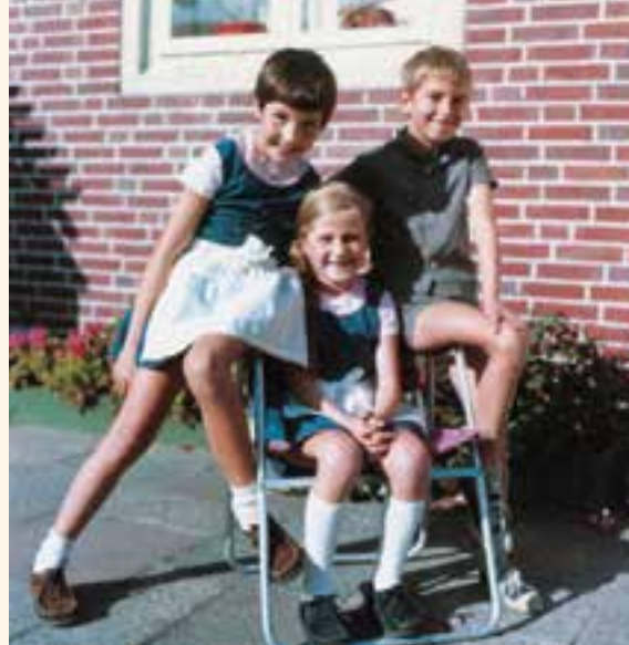
Modisch: Bayernschick war auch im Norden angesagt

Ein Kleidungsstück, das viele Stürze und Unfälle überstand und das sowohl Jungen als auch Mädchen in der Zeit vor ihrer Einschulung trugen, war die Lederhose. Viele Kinder steckten damals Tag für Tag in einer kurzen Krachledernen mit Latz. Die war robust, roch wie frisch gegerbt, war anfangs brethart und gab