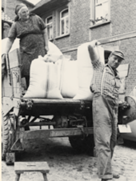
Mühsames Ernähren: Muskelkraft ersetzt in den 60ern die fehlende Technik

Findige Köche legten allerdings nicht nur Kleidungsstücke, sondern auch Leinenbeutel mit frisch geriebenen, rohen Kartoffeln in die Schleudern. Wer Klöße auf den Mittagstisch bringen wollte, hatte sie früher mühsam und stundenlang bearbeiten müssen. Jetzt nutzte man die Zentrifugalkraft der Schleuder, um das Wasser aus den Kartoffeln zu schleudern. Nach drei oder vier Umdrehungen waren die Kartoffeln fertig fürs Mittagessen. Schon jene erste Geräte-Generation war also multifunktional zu nutzen.