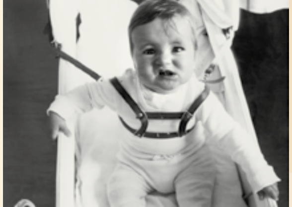
Holt mich hier raus: Wir saßen festgezurrnt im Kinderwagen

kenhaus gönnten ihm die Krankenschwestern einen kurzen Blick auf das Baby. Das durfte er sich meist nur hinter einer Scheibe ansehen. Damit war das Kind sicher vor Besuchern und vor Bakterien.