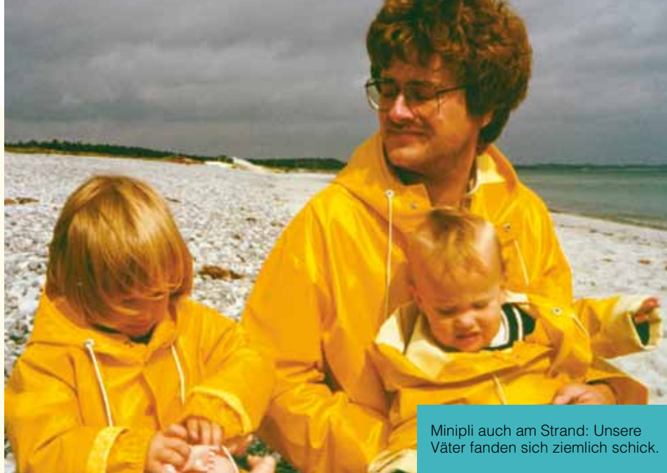
Minipli auch am Strand: Unsere Väter fanden sich ziemlich schick.