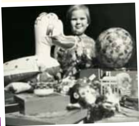
Dieser Geburtstag brachte viele Geschenke.