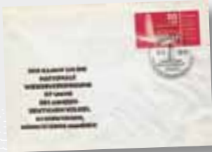
Offizieller politischer Zeitgeist 1958.

auf den tiefsten Stand seit Gründung des Landes sank, um 1960 auf 199 188 anzuschwellen und bis zum August 1961 auf 159 730 anzusteigen, wobei monatlich etwa 19 000 Menschen die DDR verließen.