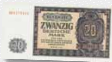
Kindergeld für unsere Eltern.