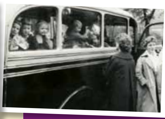
Kindergarten-Ausflug, nach 1960.

bereits zwei Jahre früher als die BRD eingeführt. Bis 1974 arbeiteten in den Krippen und Kindergärten Säuglings- und Krankenschwestern, später gab es eine mehrjährige Ausbildung.