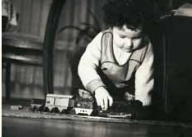
Die Blecheisenbahn war das Größte.

Zum Begreifen, wer das Männlein ist, das im Walde steht, brauchten wir allerdings etwas länger, da half erst der Opernbesuch bei „Hänsel und Gretel“. Auch die „Negelein“, mit denen die Kissen bestückt waren, hatten uns eine geraume Zeit fürchten lassen, das arme darin besungene Kind müsse erst mit Eisennägeln bestückt werden, um einzuschlafen.