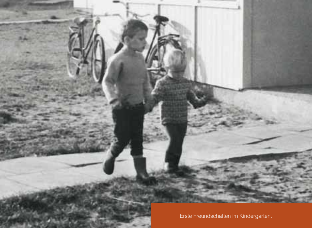
Erste Freundschaften im Kindergarten.

Meist war danach noch Zeit für einen Spaziergang. Die ganz Kleinen saßen zu sechst in einem Wagen und betrachteten die Umwelt. Die Größeren gingen an der Leine: ein langer Strick mit Laschen, an die alle anfassten. So konnte keins verloren gehen. Zurück im Haus, gab es Mittag – extra für kleine Mägen zusammengestellt und im Hause gekocht.