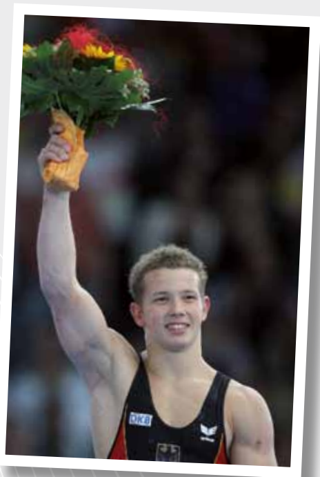
Kunstturner Fabian Hambüchen.