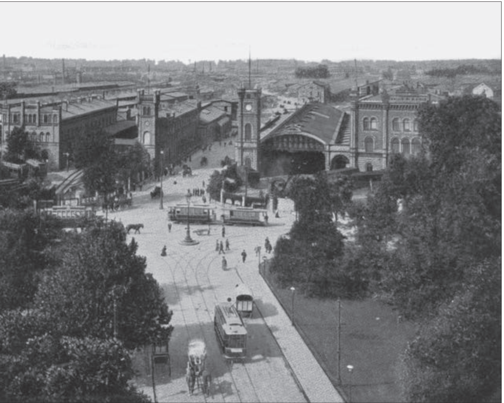
Blick aus der Goethestraße auf die Bahnhöfe an der Promenade. Rechts der Dresdner, links der Magdeburger und noch weiter links sind Teile des Thüringer Bahnhofs zu erkennen. Schöne, im Original handcolorierte Ansichtskarte. Aufnahme um 1900.