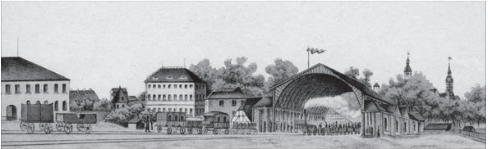
Ankunft auf Leipzigs Dresdner Bahnhof