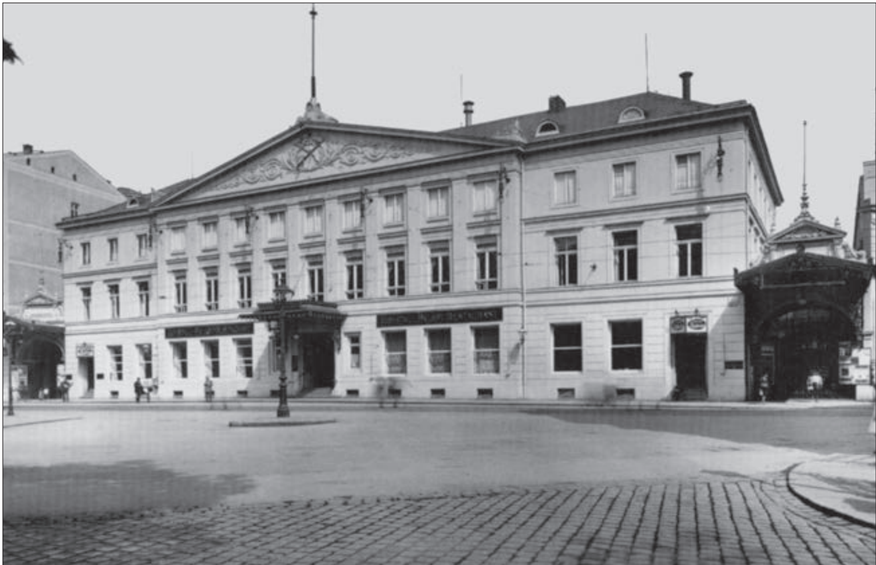
Haupteingang des Krystallpalastes an der Wintergartenstraße.

Ein neues und begeistert von der Bevölkerung angenommenes Verkehrsmittel belebte ab Juni 1913 den Stadtverkehr, der Kraftomnibus. Der „Dachgarten“ war bei schönem Sommerwetter stets voll besetzt. Zunächst gab es zwei Linien. Im Herbst des gleichen Jahres kamen drei weitere hinzu. Die Freude währte indess nur kurz. Mit Ausbruch des Ersten Weltkrieges beschlagnahmte die Oberste Heeresleitung den gesamten Fahrzeugpark.