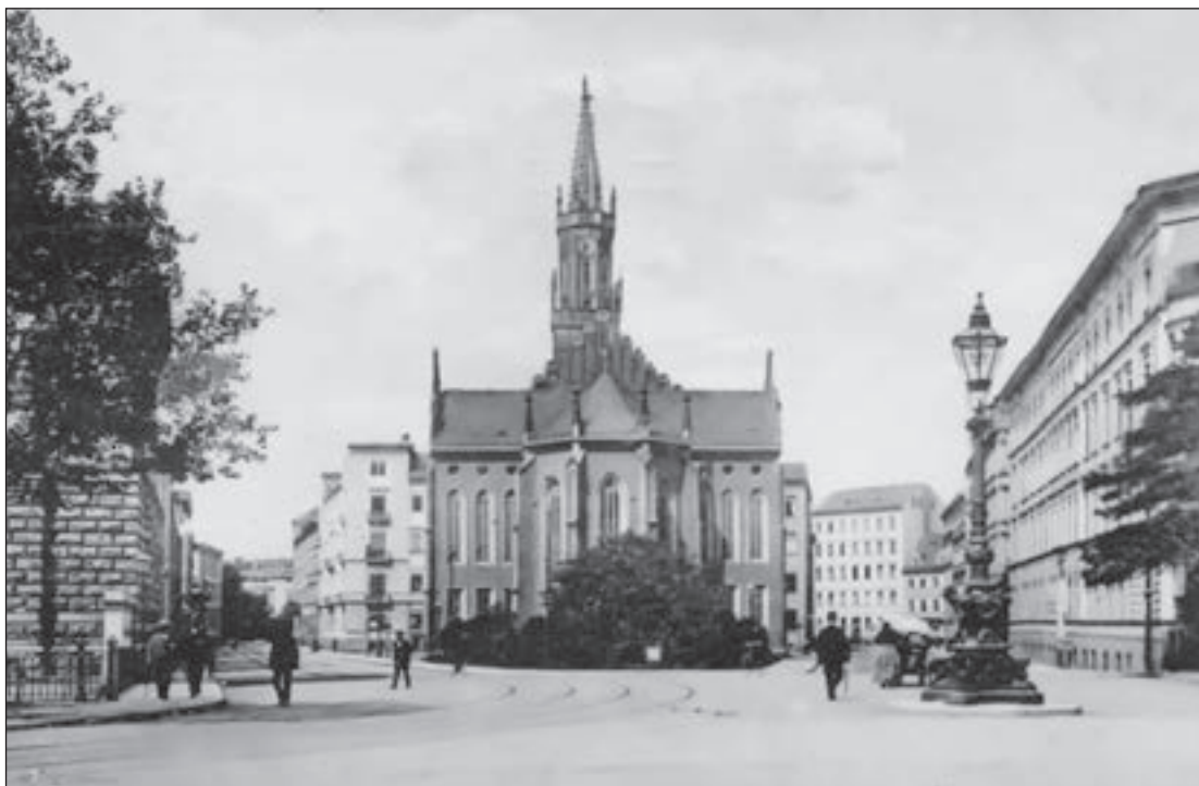
Die katholische Kirche St. Trinitatis von der Pleißenburg bzw. von der Schloßbrücke aus gesehen. Rechts blicken wir in die Rudolph-, links in die Weststraße. St. Trinitatis war der erste katholische Kirchenbau in Leipzig seit der Reformation. Der Baumeister war Carl Alexander von Heideloff, geweiht wurde das neue katholische Glaubenszentrum am 19. September 1847.