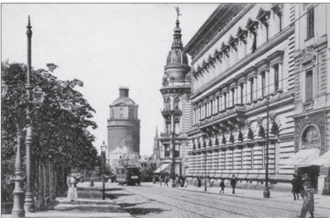
Drei Türme, gesehen von der Schillerstraße im Jahr 1899: Der dicke ist der des Schlosses Pleißenburg, das bereits weitgehend abgerissen worden war. Der zierliche (Mitte hinten) gehört zur katholischen Kirche und der große ist der des Geschäftshauses August Polich, eingangs der Petersstraße.