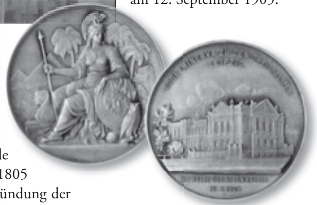
Unten: Große, attraktive Medaille zur Eröffnung des neuen Logenhauses der „Minerva“, am 12. September 1905.