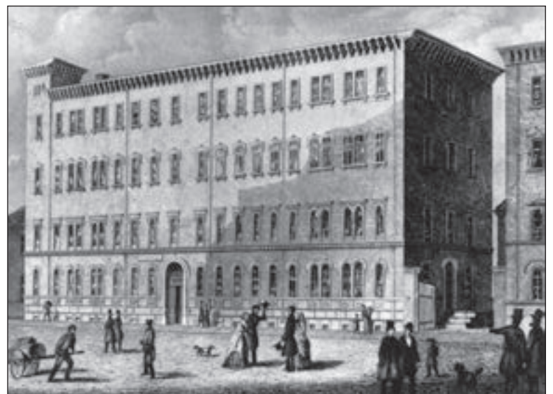
Oben: Das Haus Königstraße 3. Die Familie Mendelssohn bewohnte die gesamte I. Etage. Stich um 1850.

In der Goldschmidtstraße 12, der früheren Königsstraße 3, befindet sich dieses schöne spätklassizistische Wohngebäude, das heutige Mendelssohnmuseum. Hier verbrachte Felix Mendelssohn Bartholdy die beiden letzten Jahre seines kurzen Lebens, und hier ist er im November 1847 im Alter von nur 38 Jahren verstorben.