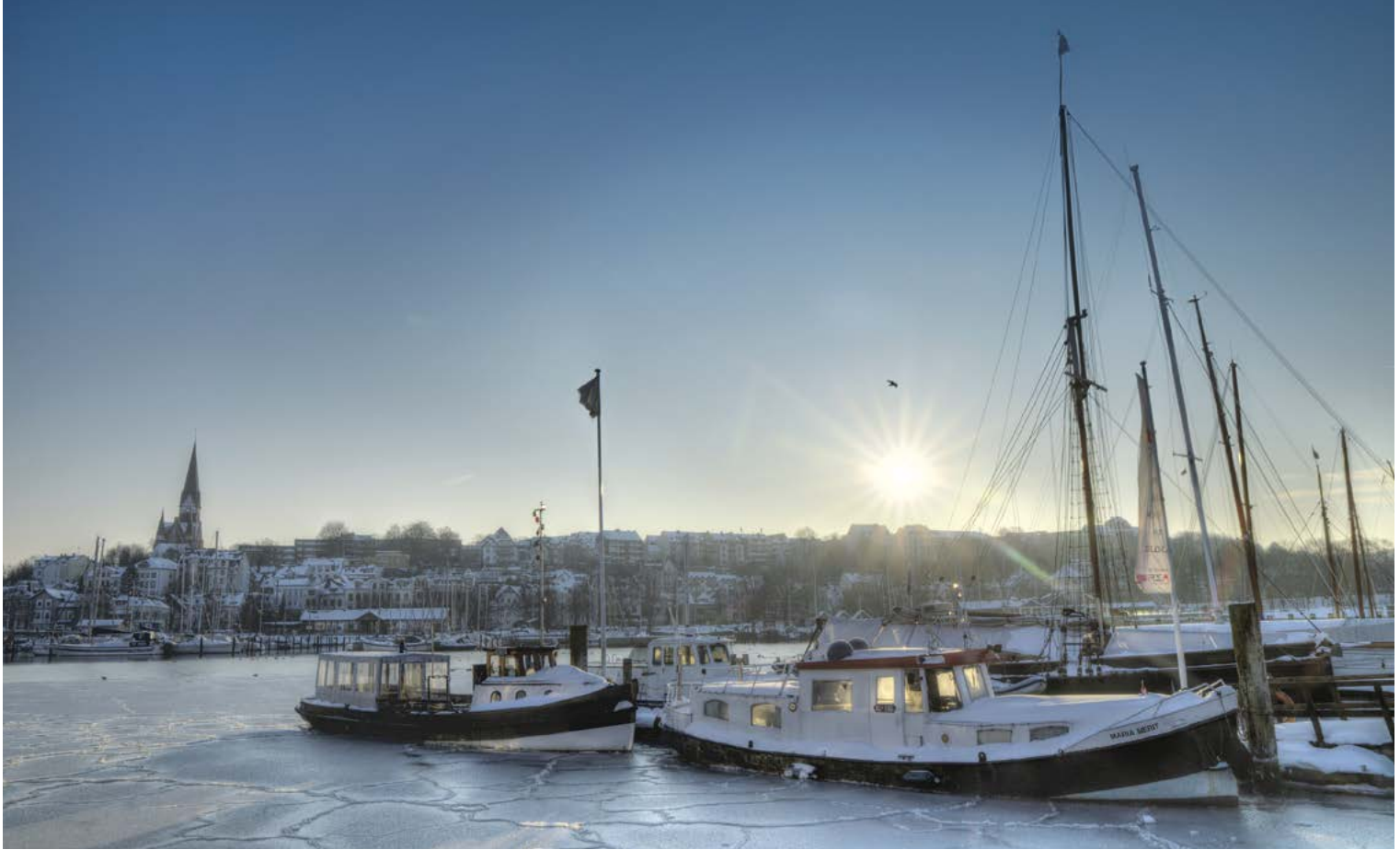
Winterstimmung mit Blick auf das Ostufer mit der St. Jürgen Kirche. | Winter atmosphere with a view of the eastern shore and St. Jürgen Church. | Østbredden med kirken St. Jürgen om vinteren.