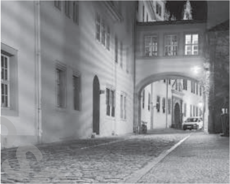
Die Kollegiengasse am Weimarer Markt bei Nacht.

Erstens: Ja, ein bisschen stimmt es. Um das Ansehen der Kulturhauptstadt zu wahren, wird viel unter den Teppich gekehrt.