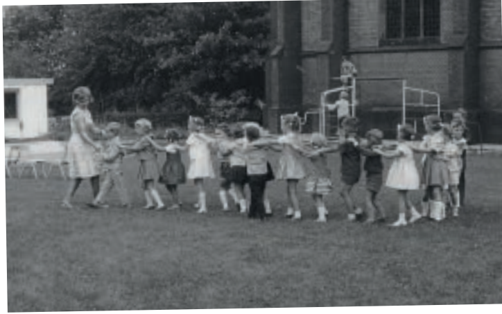
Abschiedsfest am Ende der Kinder- gartenzeit.

Die Erzieherinnen nannten wir Tanten und sie wurden unsere wichtigsten Bezugspersonen außerhalb des Elternhauses. Heute würde man sagen, echte „Role-Models!“ Die Erinnerungen beweisen, wie prägend diese Zeit war: Da war der Geruch der Wachsmalstifte nach Bienenhonig, die immer wiederkehrende mahnende Anleitung beim Basteln mit Papier: „Immer Ecke auf Ecke!“, das Singen von Kinderliedern, der Besuch des Kasperle-Theaters, wenn der Kasper mit der Klatsche das Krokodil in die Flucht trieb.