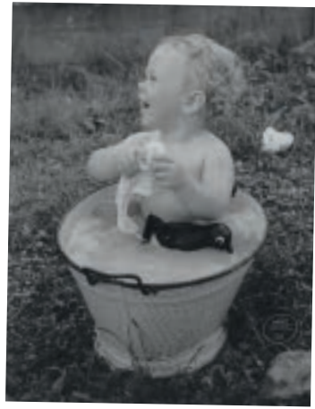
Ein Bad im Freien, das konnte uns freuen.

Fußballweltmeisterschaft: Vier Spiele finden im Westfalenstadion statt.