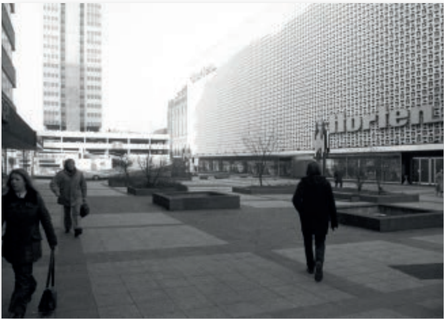
Nüchterne Kaufhausfassaden prägten das Stadtbild.