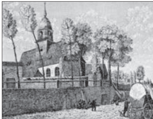
Die Nikolaikirche auf dem Kapellenberg, Ansicht Mitte des 19. Jahrhunderts

Die Siedlung der Kaufleute könnte sich unterhalb des Kapellenberges in der Nähe dieser Chemnitzfurt befunden haben. Vermutlich errichteten dort die Kaufleute eine hölzerne Kapelle, die sie nach ihrem Schutzpatron, dem heiligen Nikolaus, benannten. Das Nikolaipatrosinium gilt als typisch für Kaufmannssiedlungen im 12. Jahrhundert. Auf dem Gelände des Nikolaifriedhofes fanden noch viele Jahrzehnte später die so genannten Landdinge, also Gerichtszusammenkünfte jener Klosterdörfer (dreimal jährlich), statt, für die der Abt Gerichtsherr war. Das spricht für die besondere Bedeutung dieses Gebietes. Eine letztendliche Aussage ist aber auf Grund fehlender schriftlicher und archäologischer Quellen nicht zu treffen. Ende des 12. Jahrhunderts wurde die Nikolaikirche in Stein errichtet, da war sie aber vermutlich schon die Kirche für das Klosterdorf Kappel.