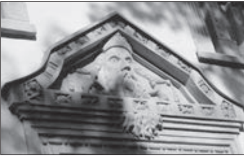
Kaiser Barbarossa, Darstellung an einem Haus auf dem Chemnitzer Kaßberg (Hübschmannstraße 19)