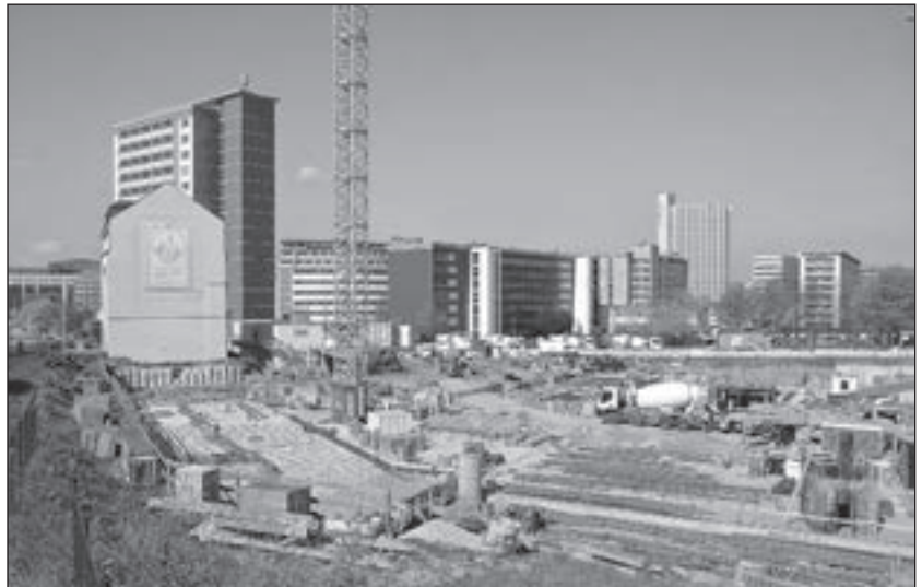
Baugrube im „Conti-Lock“ an der Bahnhofstraße für das neue Technische Rathaus

Wie für andere Städte und Gemeinden brachte der 1990 eingeschlagene Weg die kommunale Selbstverwaltung. An die Stelle der früheren Stadtverordnetenversammlung traten demokratisch gewählte Stadträte. Entsprechend der Sächsischen Gemeindeordnung wurde 1994 auch erstmals der Oberbürgermeister in Direktwahl gewählt. An die Stelle der Einteilung in drei Stadtbezirke ist die Gliederung in Stadtteile getreten, teilweise aus mehreren früheren Vororten bestehend.