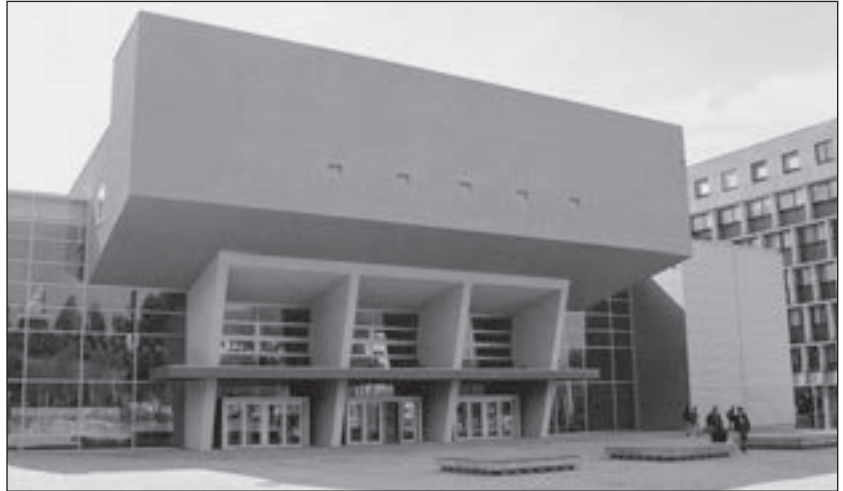
Neues Hörsaal- und Seminargebäude der TU an der Reichenhainer Straße

Sowohl Chemnitz als auch sein Umland wurden nach der politischen Wende und der Währungsunion von einem Strukturwandel besonders im verarbeitenden Gewerbe erfasst, der das Wegbrechen klassischer Industriezweige, wie z. B. der Textilindustrie und von Bereichen des Maschinenbaues, zur Folge hatte. Die langjährigen Beziehungen zu den osteuropäischen Ländern konnten nicht weitergeführt werden, die Nachfrage nach Erzeugnissen ging schlagartig zurück. Die Betriebe begegneten dem durch drastische Entlassungen. Die mit der Privatisierung durch die Treuhandanstalt verbundenen Probleme hatten den weiteren Abbau von Arbeitskräften zur Folge.