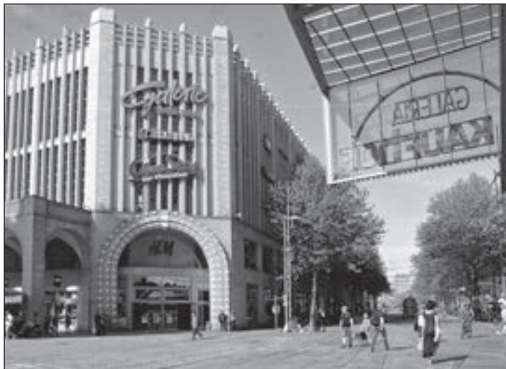
„Galeria Kaufhof“ und Galerie „Roter Turm“

Bestandteil der Bewerbung waren aber auch die zahllosen Fäden, durch die die Industriestadt mit der Montanregion des Erzgebirges, nun UNESCO-Welterbe, verknüpft ist. „C the Unseen“ lautet die Aufforderung, den Blick auf das Ungesehene, wenig Spektakuläre, aber auch auf die Menschen zu richten, die für diese Landschaft so typisch sind und ohne deren Fleiß und Pragmatismus unser Alltag kaum denkbar wäre.