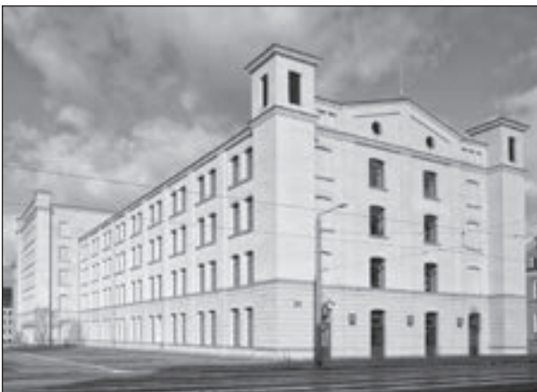
Die zur Universitätsbibliothek ausgebauten Alte Aktienspinnerei

Diese gravierenden Veränderungen hat die Stadt aber mit ihrem großen Potenzial an gut ausgebildeten Facharbeitern und Ingenieuren gemeistert. Sie hat sich wieder zu einem modernen Standort für Wirtschaft, Technologie und Innovation mit weltweit agierenden Unternehmen entwickelt.