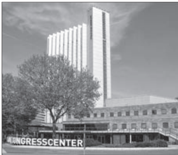
Dorint Kongresshotel und Carlowitz Congresscenter

An der Wende zum 21. Jahrhunderts wurde, beginnend mit der Eröffnung der Galerie „Roter Turm“ und der „Galeria Kaufhof“, wieder eine Belebung der Innenstadt eingeleitet. Zwanzig Jahre danach findet die City mit der Neuen Johannisvorstadt ihre Abrundung. Zugleich ist die Wertschätzung für die Bauten der „Ostmoderne“ im Stadtzentrum, darunter des Ensembles um das Karl-Marx-Monument, der Stadthalle mit ihrem Park und der Pylonendachkonstruktion des Omnibusbahnhofs, gewachsen.