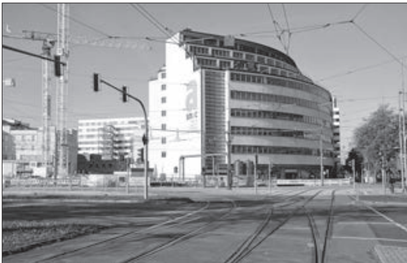
Staatliches Museum für Archäologie (smac) im ehemaligen Kaufhaus Schocken

Ihre individuelle kulturelle Prägung erhielt die Stadt außerdem durch eine Vielzahl von Initiativen und Vereinen, durch bekannte Festivals und Projekte. So ziehen die 1992 ins Leben gerufenen „Tage der jüdischen Kultur“, das seit 1995 durchgeführte Stadtfest, das neuerdings als Bürgerfest wiederbelebt wurde, und das seit 2003 jährlich stattfindende Kunstfestival „Begehungen“ viele Einwohner und Gäste der Stadt in ihren Bann. In das Gebäude der ehemaligen Bezirkszentrale der Staatssicherheit auf dem Kaßberg sind das Umweltzentrum, das Haus „Arthur“ und das Frauenzentrum „Lila Villa“ eingezogen. Wie andernorts erfuhr auch in Chemnitz das kulturelle Leben durch die Corona-Pandemie starke Einschränkungen.