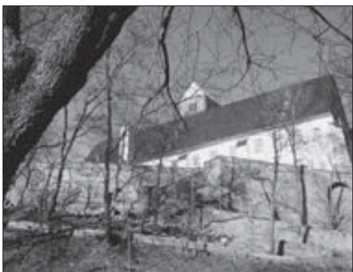
Das Benediktinerkloster und spätere Schloss (heute: Schloßbergmuseum)

Noch im 12. Jahrhundert zeichneten sich Auseinandersetzungen zwischen dem Reichsoberhaupt und den Markgrafen ab, weil sich nach dem Übergang des alten Reichsgutes um Rochlitz 1143 an den Markgrafen das Kaiser-/Königtum intensiver auf das noch bestehende Reichsgelände orientierte.