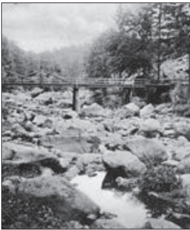
Das Chemnitztal (Schweizertal)

1893 beging man eine 750-Jahrfeier der Stadtgründung, als verbindliches Dokument wurde die Urkunde zur Marktrechtsverleihung an das Kloster von 1143 betrachtet. Darin ist aber nicht von einer Stadt, sondern lediglich von einem „locus Kameniz“ die Rede. Nach 1952 existierte die Auffassung, die Stadt sei 1165 auf „wilder Wurzel“ entstanden. Beim Stadtjubiläum 2018 bezog man sich aber wieder auf die urkundlicher Ersterwähnung von 1143.