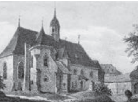
Die Johanniskirche, Ansicht Mitte des 19. Jahrhunderts

Auch die Wasserversorgung könnte ein zwingender Grund für den Umzug gewesen sein. Um die Johanniskirche war der Gablenzbach der Wasserlieferant. Vielleicht genügte er nicht für die Versorgung, während aber die Chemnitzau mit einem Grundwasserspiegel von geringer Tiefe besser den Bedürfnissen entsprach. Sicherlich bestanden auch Verbindungen zwischen Stadnanlage und Stadtbefestigung. Wahrscheinlich eignete sich die neue Lage besser für eine stabile Ummauerung. Damit folgte man einem kaiserlichen Erlass, der den Städten vorschrieb, sich mit Mauern zu umgeben.