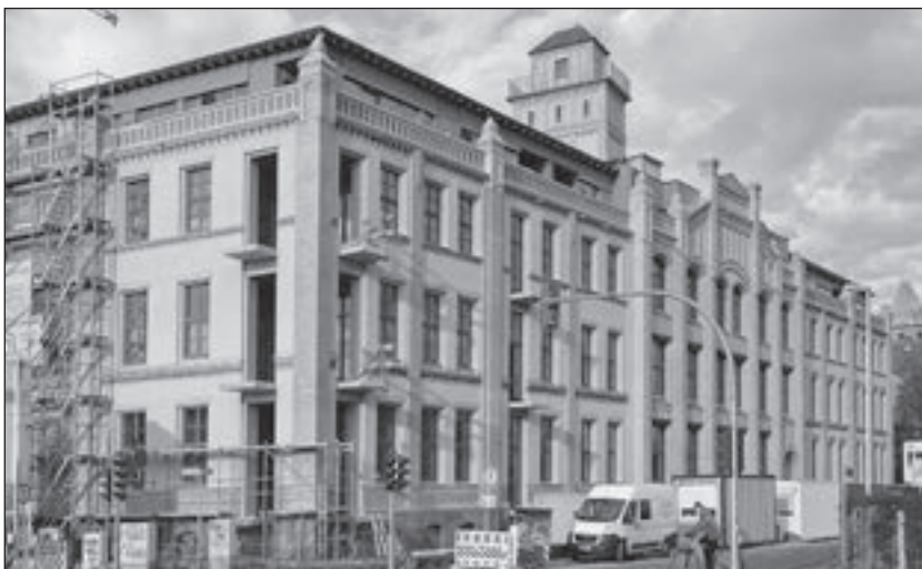
Umbau der ehemaligen Fahrzeugelektrik zum Wohnhaus

Ging die Errichtung großer Neubaugebiete einst von wachsenden Bevölkerungszahlen aus, so hat mit dem Rückgang der Einwohnerzahl in den letzten Jahren auch der Wohnungsleerstand zugenommen. Dies, obwohl gerade bei der Stadtentwicklung, Stadterneuerung und Wohnumfeldverbesserung enorme Fortschritte erreicht werden konnten, in allen Stadtteilen in großem Umfang gebaut, saniert und rekonstruiert wurde. Die sozialen Unterschiede zwischen den Stadtteilen und innerhalb dieser sind aber unübersehbar wieder aufgebrochen.