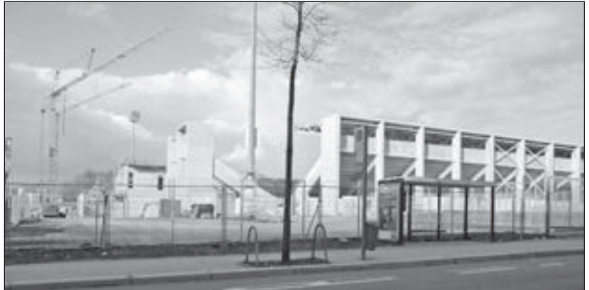
Errichtung des neuen CFC-Stadions 2015

Machten vor allem Leistungssportler des Eiskunstlaufs und des Radsports den Namen Karl-Marx-Stadt in der Welt bekannt, so haben heute sechs Sportarten in Chemnitz ihren Bundesstützpunkt – darunter Eisschnelllauf, Gewichtheben, Leichtathletik und Turnen. Der Chemnitzer Fußballclub erhielt ein modernes Stadion, aber auch traditionelle Anlagen wie das Sportforum oder die Eishalle sind in letzter Zeit einer Sanierung unterzogen worden. 35 500 Mitglieder wirken in den Sportvereinen.