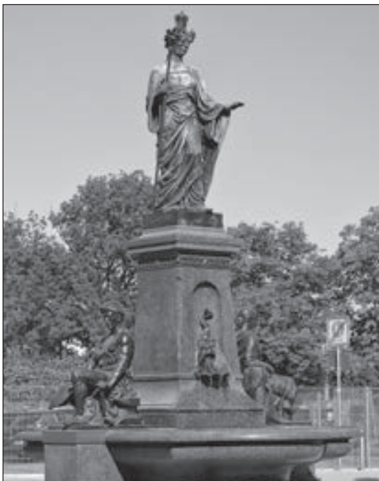
Der am Johannisplatz wiedererrichtete Saxoniabrunnen

Dem Verein Figürliches Glockenspiel und dem Saxoniabrunnenverein gelang es durch hartnäckiges Bemühen, dem Stadtbild Verlorengegangenes wiederzugeben. Auch der Tisch der Heimat- und Denkmalpfleger brachte sich in verschiedene kommunale Entscheidungsprozesse ein. Dabei sind es in Chemnitz meist kleine Personenkreise Engagierter, die angeblich alternativlose Projekte kritisch hinterfragen und aufmerksam verfolgen. Bei den Bürgern wächst jedoch das Bewusstsein für die Verluste und Folgekosten, die nicht nachhaltig bedachte Vorhaben mit sich bringen. So ging aus der Mitte des Stadtforums, das seit Jahren kommunale Vorhaben kritisch begleitet, der Viadukt e.V. hervor. Mit dem Rückhalt zahlreicher Bürger erreichte dieser Verein, dass das stadtbildprägende Eisenbahnviadukt an der Annaberger Straße erhalten bleibt.