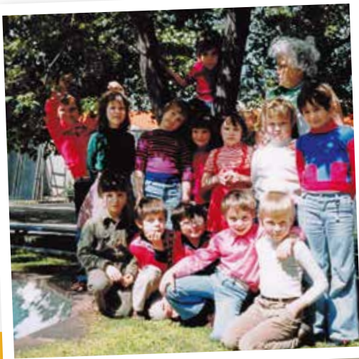
Ev. Paulus-Kindergarten, Gruppenbild 1975.

Im Kindergarten bekamen wir einen Platz für unsere Jacken und Taschen. Dort standen auch unsere Straßenschuhe, denn wie gewohnt liefen wir drinnen in Hausschuhen umher. Jeder Platz hatte ein Abziehbild und jeder von uns war froh, angekommen zu sein. Im Idealfall waren die gleichaltrigen Nachbarkinder dabei, aber wir waren ja kommunikativ und beim gemeinsamen Spielen lernten wir neue Leute kennen, saßen zusammen und verbrachten die Pausen miteinander.