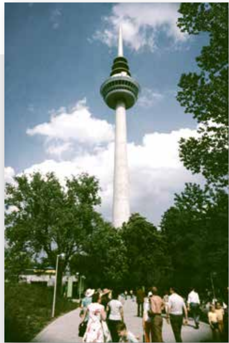
Blick zum neuen Wahrzeichen Fernmeldeturm, 1975.

In F 3 konnte 1987 die Neue Synagoge nebst Gemeindezentrum eingeweiht werden. Karl Schmucker lieferte die Pläne.