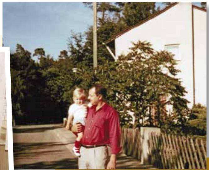
Vater und Sohn: Auch Laufen will gelernt sein.

Nicht jeder von uns hatte das Glück, dass ein Elternteil zu Hause war, viele Mütter waren berufstätig und wir kamen in die Obhut einer Kinderkrippe. Auch hier war unsere Erziehung eher weiblich. Manchmal machten die Großeltern diesen „Job“ und sie machten ihn gut. Denn bei Oma und Opa durften wir ja stets mehr als zu Hause. Da gab es etwas zu naschen, wir wurden zunächst gefahren, später trabten wir brav nebenher, gingen mit einkaufen, in den Garten oder einfach nur spazieren.