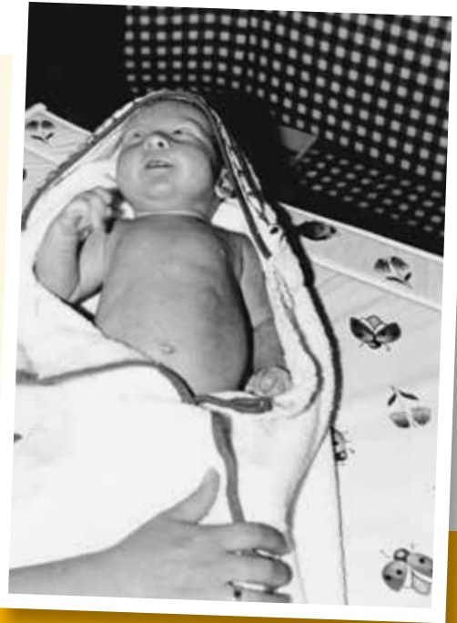
Alles dran, was dazugehört!

Festgottesdienst: 30 Jahre polnische Gemeinde.