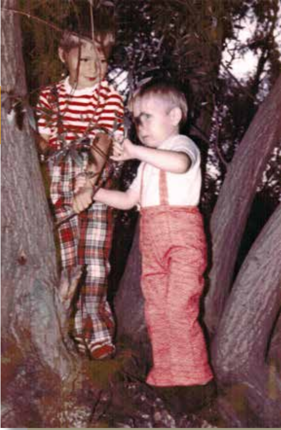
Cousins machen einen Ausflug. Altriiper Rheinufer, 1973.

blieb zumindest die heile kleine Welt nahezu ohne Streit erhalten. Omas wurden um die Wette gekämmt und um Opas Gunst wurde gebuhlt. Beide machten uns die schönsten Geschenke und – oh Wunder – wir Kinder bekamen auch oftmals dasselbe. Wie langweilig! Heute wissen wir: Die hohe Kunst der Streitvermeidung hatten diese Herrschaften hinlänglich erproben können. – und zwar an unseren Eltern.