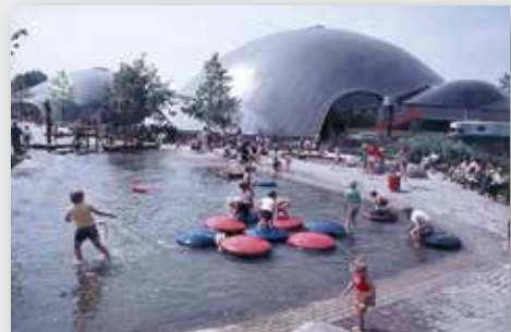
Multihalle im Herzogenriedpark zur Bundesgartenschau 1975.