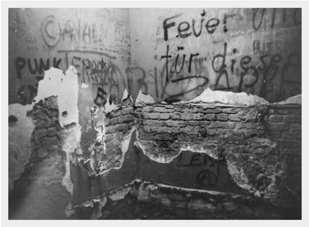
Das „Design“ im Schuppen war ein wenig „gammelig“. Den Gästen gefiel es.