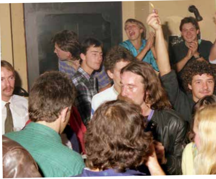
In der Altstadt-Kneipe Pille wird ausgelassen gefeiert.