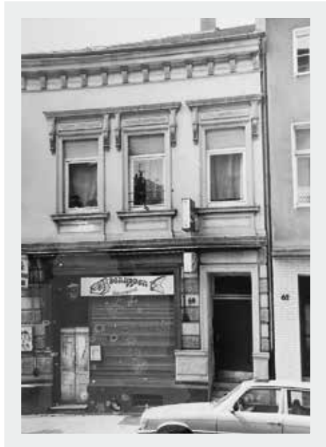
Der Schuppen von außen.

Und nun wollen auch wir in einer Kneipe der Altstadt hängen bleiben: Wir machen unseren ersten Zwischenstopp.