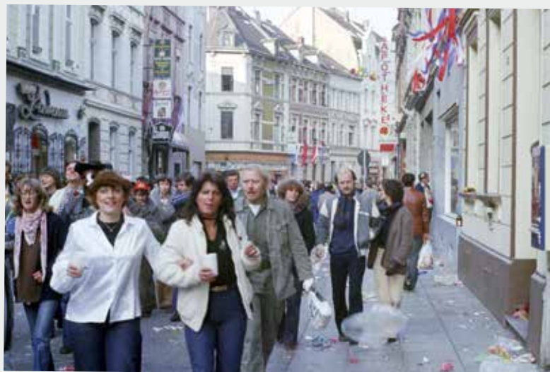
Die belebte Breite Straße in der Altstadt, Rosenmontag 1980.