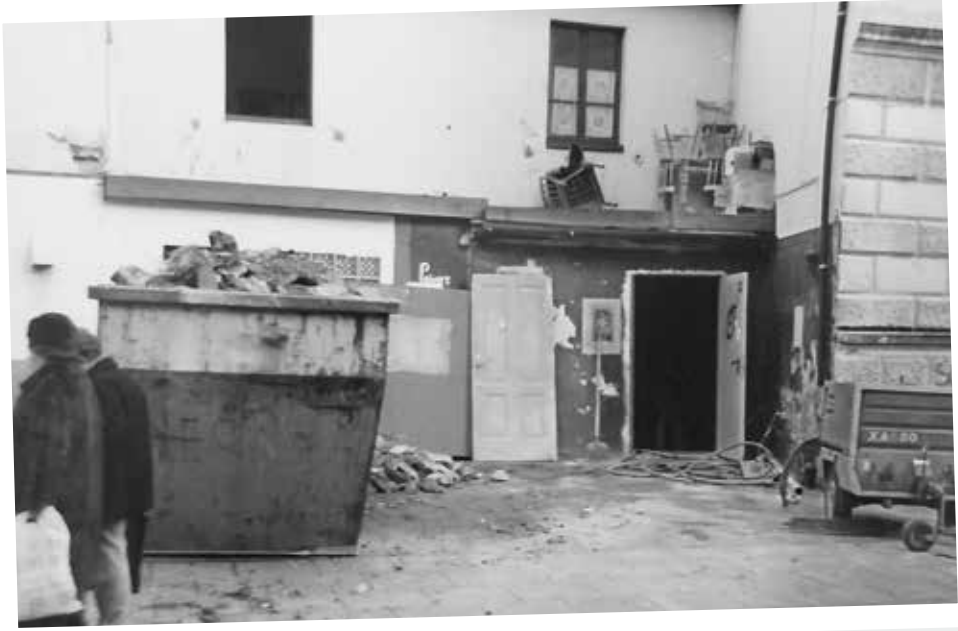
Als der Schuppen Ende der 70er umgebaut wurde, packten die Stammgäste mit an.