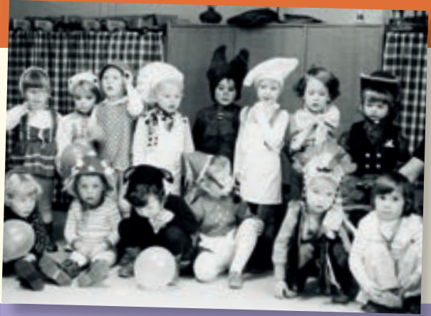
Köche, Pilze, Cowboys und Mäuse beim Kinderfasching.

Der polnische Kardinal Karol Wojtyła wird Papst Johannes Paul II. ist der dritte Papst innerhalb eines Jahres und seit 455 Jahren der erste nicht-italienische Papst.