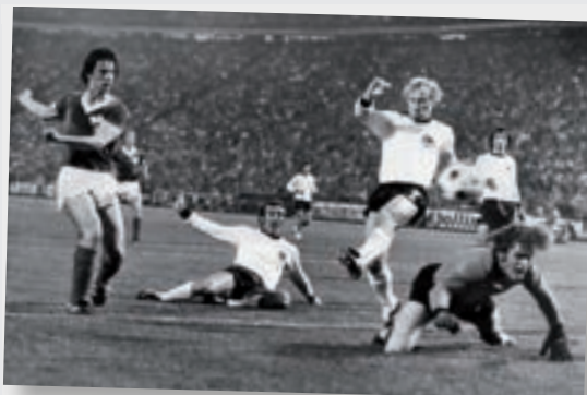
Jürgen Sparwasser schießt das 1:0 für die DDR im WM-Spiel gegen die BRD.

treffer für die Mannschaft der DDR. Mit diesem 1:0-Sieg des Außenseiters ging dieses Fußballspiel in die Geschichte ein. Denn die Niederlage erschütterte das Selbstvertrauen der Bundesdeutschen stark, weil keiner ernsthaft mit dem Sieg der DDR-Mannschaft gerechnet hatte. Aber wie sagten unsere Großmütter immer: „Manchmal verliert man und manchmal gewinnen die anderen“. Dennoch schaffte die Mannschaft der DDR nicht den Gruppensieg der Zwischenrunde gegen Brasilien, Argentinien und die Niederlande und schied aus. Die Nationalelf der Bundesrepublik holte am Ende den Weltmeistertitel.