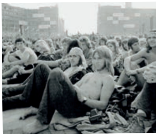
Weltfestspiele 1973: Jugendliche auf dem Alex.

treffer für die Mannschaft der DDR. Mit diesem 1:0-Sieg des Außenseiters ging dieses Fußballspiel in die Geschichte ein. Denn die Niederlage erschütterte das Selbstvertrauen der Bundesdeutschen stark, weil keiner ernsthaft mit dem Sieg der DDR-Mannschaft gerechnet hatte. Aber wie sagten unsere Großmütter immer: „Manchmal verliert man und manchmal gewinnen die anderen“. Dennoch schaffte die Mannschaft der DDR nicht den Gruppensieg der Zwischenrunde gegen Brasilien, Argentinien und die Niederlande und schied aus. Die Nationalelf der Bundesrepublik holte am Ende den Weltmeistertitel.