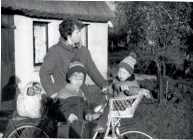
Auf dem Fahrrad hatte jeder Platz und auch der Einkauf!