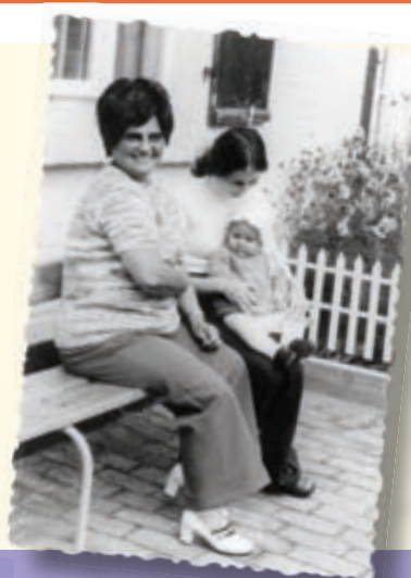
Stolz wird der Nachwuchs präsentiert.

Da war er nun, unser erster Schrei nach der Geburt. Glückliche, aber erschöpfte wir in die Arme von Mama sinken, denn die aufgeregten Väter mussten auf dem Flur der Poliklinik, der Geburtsstation oder sogar zu Hause warten, bevor sie den Nachwuchs bestaunen durften. An die geburtliche Unterstützung der