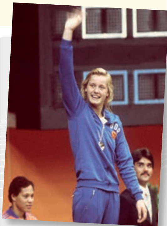
DDR-Schwimmerin Kornelia Ender war in Montreal die erfolgreichste Sportlerin der DDR (4 x Gold, 1 x Silber).

Die im selben Jahr stattfindenden XXI. Olympischen Sommerspiele in Montreal verliefen für die DDR ebenso erfolgreich. Sie kam wieder auf den zweiten Platz in der Gesamtwertung hinter der UdSSR. Besonders erfolgreich waren die Schwimmerinnen, die von 13 Wettbewerben elf