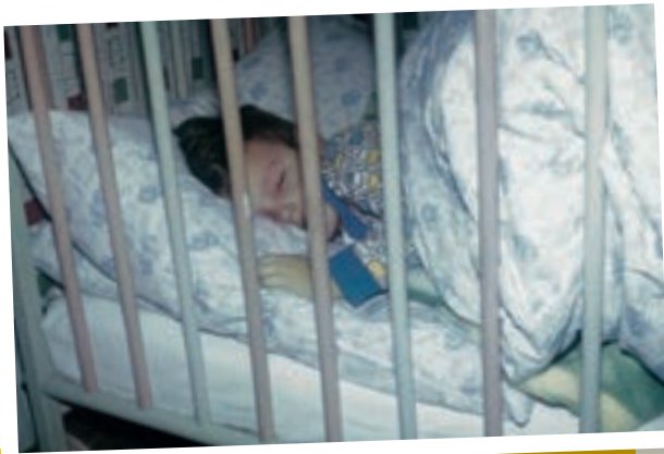
„Hinter Gittern“: Die typische Schlafstatt für ein Kleinkind, das nicht aus dem Bett fallen sollte.