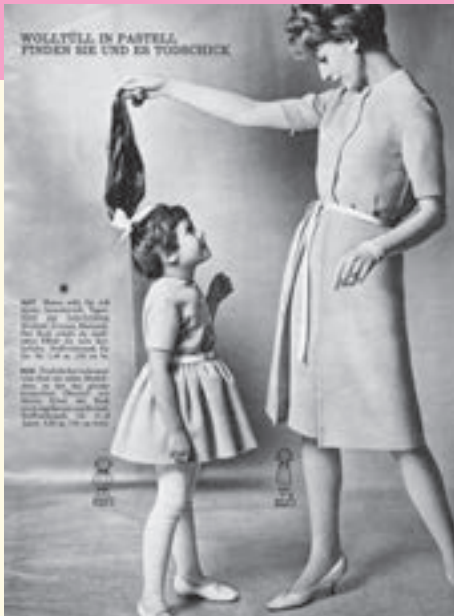
Ein Wolltüllkleid für Mutter und Tochter empfiehlt der Burda-Moden-Katalog von 1963.

ten wir im Laufstall herum und nur draußen auf der Schaukel gingen uns die Gitterstäbe des Sitzchens zum Glück nur bis zum Bauch. Wir ließen uns nicht irritieren, schauten einfach durch die Gitterstäbe durch, als wenn sie gar nicht da wären und hielten uns daran fest, wenn uns danach zumute war. Manchmal war uns allerdings auch danach zumute, unserer Mama, wenn sie das Zimmer verließ, ganz schnell hinterherzukrabbeln. Dann waren diese Gitter wirklich im Weg und weil wir sie nicht auseinanderbiegen konnten, bogen sich unsere Stimmbänder.