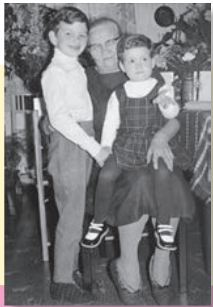
Ob mit oder ohne Hoppe-Reiter: Auf Omas Schoß fühlten sich alle Enkel wohl.

Wie viele Jahrgänge zuvor und etliche danach rutschten auch wir unermüdlich auf großväterlichen und großmütterlichen Schößen herum, um zur Melodie von „Hoppe, hoppe Reiter, wenn er fällt, dann schreit er“ einen stets von starken Armen abgemilderten Sturz zu erleben. „Fällt er in den Graben, denn fressen ihn die Raben, fällt er in den Sumpf, dann macht der Reiter plumps.“ Und sobald wir laufen konnten, wollten wir fliegen. Das ging tatsächlich. Links und rechts an den Händen von zwei Erwachsenen gehalten, zwei, drei schnelle Schritte und dann die Beine in die Höh': „Engelchen, Engelchen fliiiiiiieg“. Das „Engelchen“ war in diesem Fall (oder Flug) wirklich ein bezeichnender Ausdruck, denn das Uns-fliegen-Lassen ging den Erwachsenen ganz schön in die Arme (je schwerer wir wurden, desto mehr) und deshalb musste man recht artig sein, wenn man als Engelein zum Fliegen gebracht werden wollte.