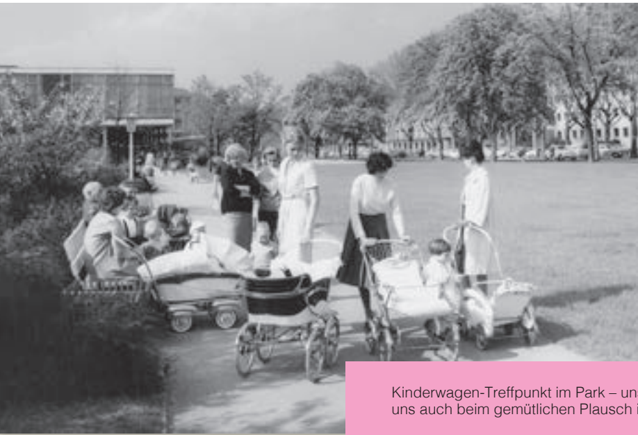
Kinderwagen-Treffpunkt im Park – unsere Mütter behielten uns auch beim gemütlichen Plausch immer im Auge.

das Vorhandensein des neuen Erdenbürgers in der Verwandtschaft und der näheren Umgebung herumgesprachen, da war auch schon die Taufe. Länger als sechs Wochen wurde selten gewartet. Die Taufpatinnen oder Taufpaten hatten sich unsere Eltern vorher ausgeguckt. In der Regel handelte es sich um Onkel oder Tanten.