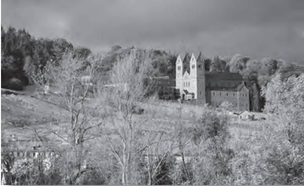
Die 1904 erbaute Abtei St. Hildegard in Eibingen im Rheingau.

Heute erhebt sich in der Nähe des Klosters, das im Dreißigjährigen Krieg von den Schweden zerstört wurde, das an die digitalen Bedürfnisse der Zeit angepasste Hildegardzentrum. Es befindet sich in den Mauern der ehemaligen katholischen Kirche und lädt ein zum stillen Gebet oder Psalmgesang per Knopfdruck. Hier führt auch der Hildegard-Pilgerweg vorbei, der sich an der Nahe entlangzieht.