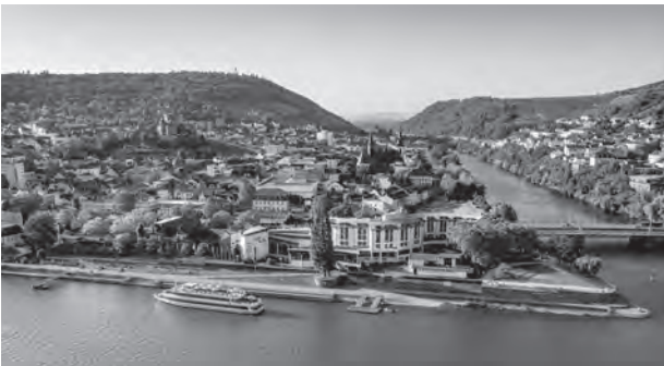
Hier am Rhein-Nahe-Eck erhob sich gegenüber von Bingen das Kloster Rupertsberg.

»Posaune Gottes«, Prophetin, Politikerin, Komponistin, Kirchenlehrerin und Naturkundlerin, Theologin, Universalgelehrte, Ratgeberin, Medizinerin. Für jeden bedeutet sie etwas anderes, jede Zeit heftete ihr ein eigenes Etikett an, Mythen und Legenden taten ein Übriges. Als Vorkämpferin für die Emanzipation der Frau, die unverblümt mit klaren Worten Missstände in der Kirche aufzeigte und den Finger in die Wunde legte, gilt sie den einen, andere berufen sich auf die „Hildegard-Medizin“ als Alternative zur Schulmedizin.