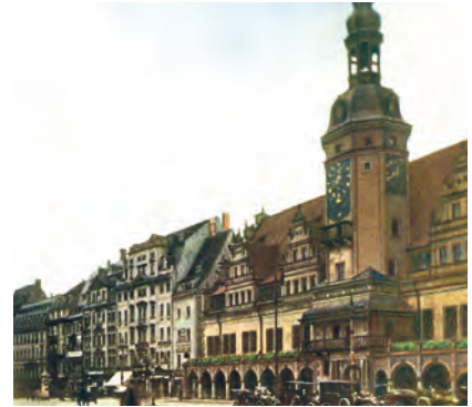
Das Rathaus und das Jöchersche Haus im Jahre 1914

Zwischen den Jahren 1943 und 1945 kam es zu mehreren Luftangriffen auf die Stadt, insbesondere der Angriff am 4. Dezember 1943 führte zu erheblichen Zerstörungen in der Innenstadt. Insgesamt forderten die Luftangriffe ungefähr 6000 Menschenleben. Die in der Gründerzeit und den Folgejahren errichteten Messepaläste und Kaufmannshäuser überstanden aufgrund ihrer massiven Bauweise das Bombardement verhältnismäßig glimpflich. Der ohnehin schon reduzierte Bestand an Bauwerken aus dem Zeitalter der Renaissance und des Barocks wurde nochmals stark dezimiert.