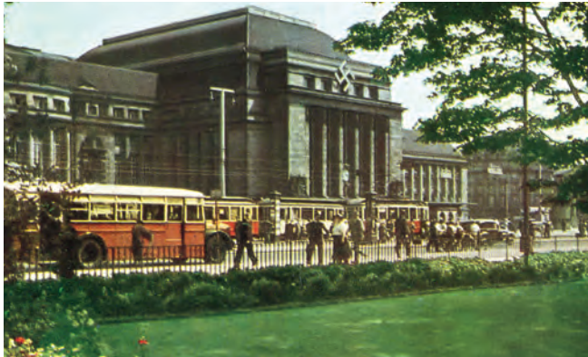
Am Leipziger Hauptbahnhof im Jahre 1939

Leipzig lag am Schnittpunkt der mittelalterlichen Fernverkehrswege von Süden nach Norden bzw. von Westen nach Osten (Grimmaische und Reichsstraße), was natürlich die wirtschaftliche Entwicklung massiv förderte. Die zweimal jährlich abgehaltene Messe (Leipzig war 1497 zur Reichsmessestadt erhoben worden) machte Leipzig zum Zentrum des Handels. Für die Entwicklung zur Messestadt maßgeblich war vor allem der Handel mit Fellen sowie deren Weiterverarbeitung. Bereits 1409 war die Prager Universität nach Leipzig verlagert worden, was für einen weiteren Bedeutungszuwachs der Stadt gesorgt hatte.