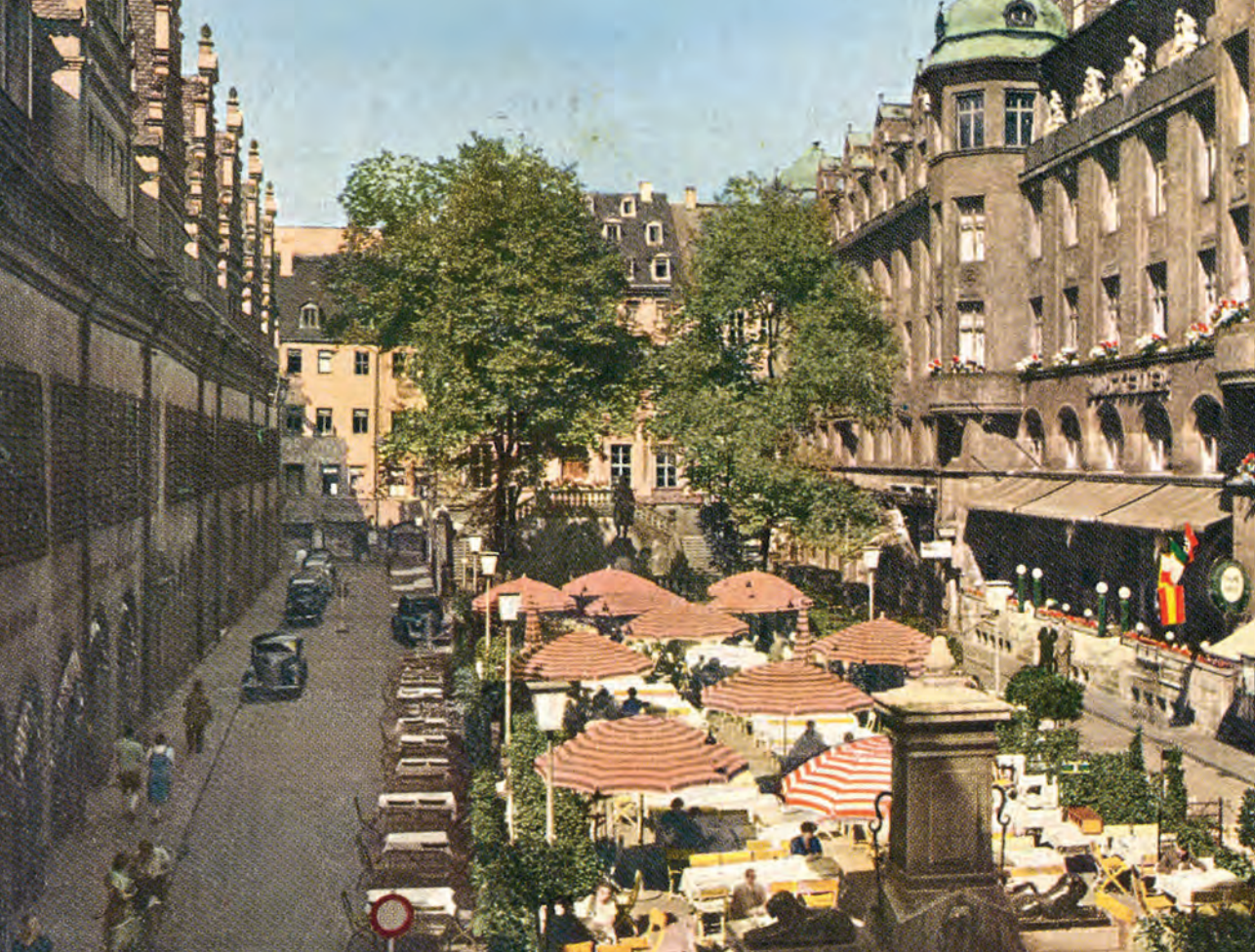
Sommerbiertgarten auf dem Naschmarkt im Jahre 1937. Links das alte Rathaus, im Hintergrund, von den Bäumen weitgehend verdeckt, die alte Börse. Der Biergarten gehörte zum Burgkeller, Naschmarkt 1–3, den wir rechts im Bild sehen. Der Burgkeller befand sich im Gebäude des 1909 errichteten Handelshofs (s. S. 30).