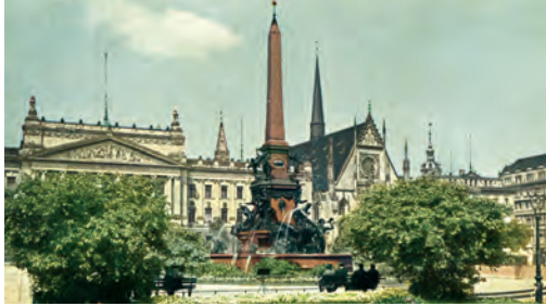
Der Augustusplatz im Jahre 1913

Während der Dauer des Siebenjährigen Krieges (1756 bis 1763) war Leipzig von den Preußen besetzt. Seit etwa 1780 wurden die alten Befestigungswerke geschleift. Um die eigentliche Altstadt herum entstand ein ringförmiger Straßenzug mit Grünanlagen.