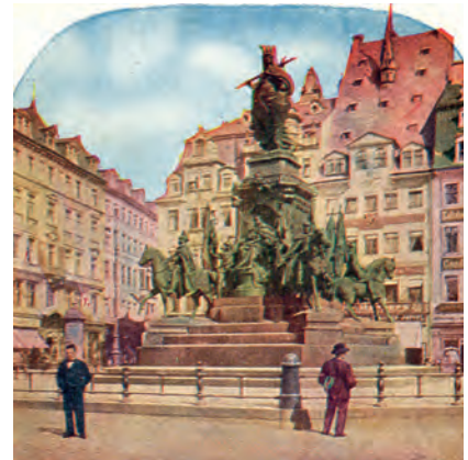
Die Marktplatznordseite und das Siegesdenkmal im Jahre 1904

Einen schweren Einschnitt in die Entwicklung der Stadt stellte, wie vielerorts, der Dreißigjährige Krieg dar. Die Bevölkerungszahl ging von 18 000 auf 12 000 zurück. Mit der Wiederbelebung des Handels nach dem Dreißigjährigen Krieg setzte erneut eine rege Bautätigkeit ein. Bauten wie die Alte Handelsbörse und eine Vielzahl barocker Bürgerbauten, wie zum Beispiel das Jöchersche Haus am Markt, entstanden und zeugten davon noch bis