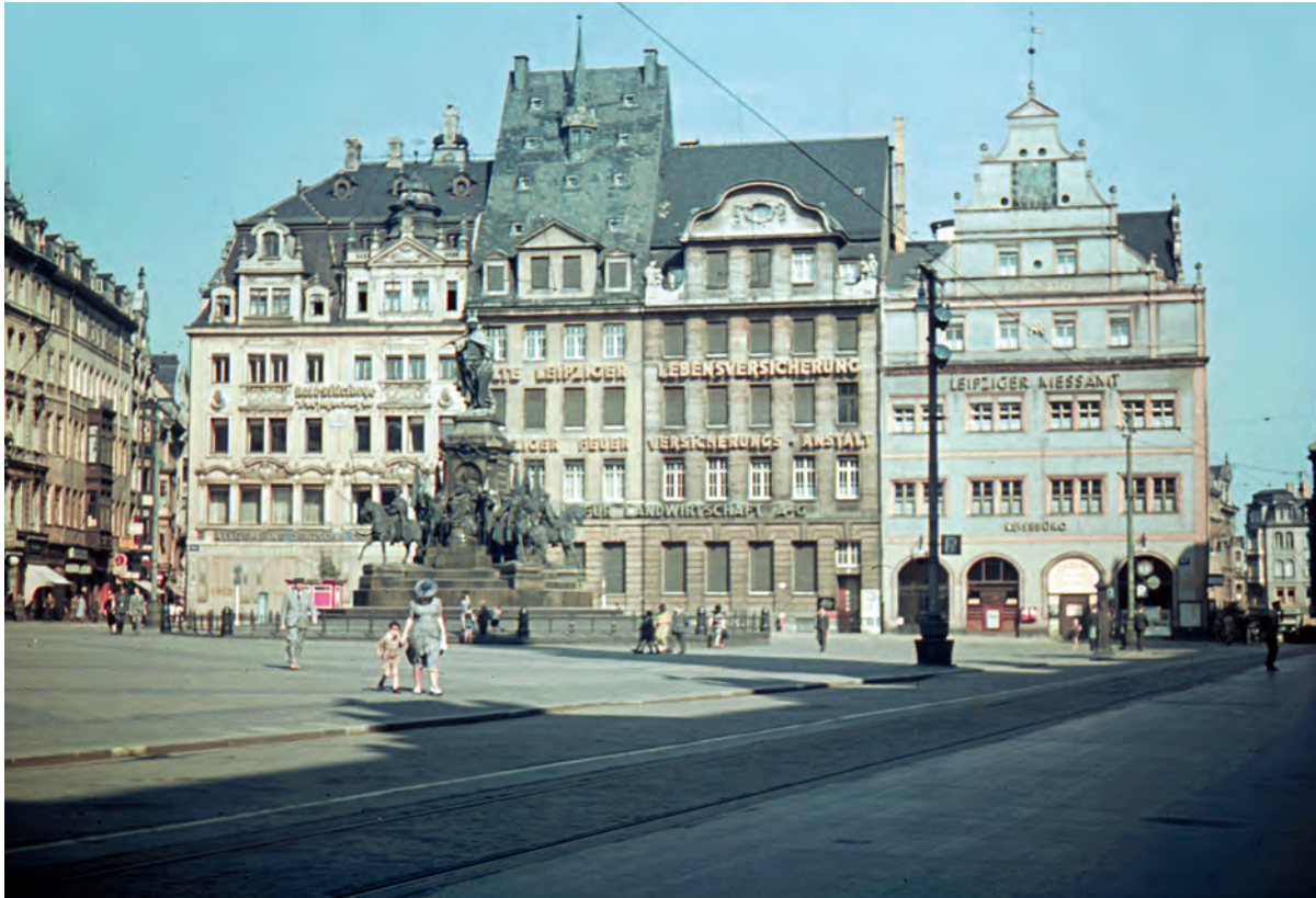
Die Marktplatznordseite um 1940. Im Vordergrund das Siegesdenkmal für den Deutsch–Französischen Krieg 1870/71 aus dem Jahre 1888. Die Häuser sind von links Hainstraße 2, Markt 7, Mitte des 17. Jahrhunderts erbaut und seit 1807 vereint. Es folgt Markt 6 mit seinem hohen Dach, 1922 erbaut (Vorgängerbau s. S. 4). Markt 5 stammt aus dem Jahre 1909. Ganz rechts die Alte Waage, Markt 4, 1555 an der Ecke zur Katharinenstraße nach Plänen von Hieronymus Lotter errichtet.