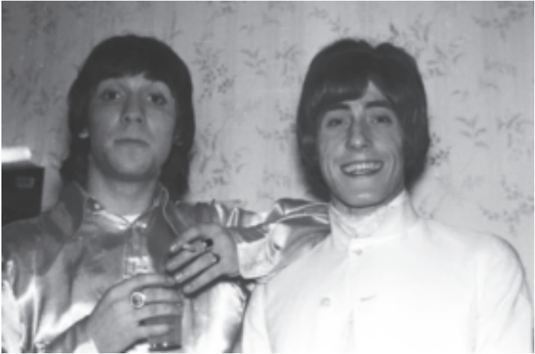
Denn sie wissen nicht, wo sie sind: Keith Moon (li.) und Roger Daltrey von The Who im Herforder Hotel Twachtmann, 10. April 1967.

bunten Drogencocktails interpretierten. Obwohl – auch wenn The Who nur noch in Luxuslimousinen herumkutschiert wurden und auch sonst nur noch erster Klasse reisten und in Fünf-Sterne-Hotels eincheckten, so kamen sie doch ursprünglich aus Shepherd's Bush, einem Londoner Stadtteil, der in den 1950er- und 1960er-Jahren nicht zu den besten gehörte. Dort wird es auch solche Hotels wie die Pension Twachtmann in der Herforder Bügelstraße gegeben haben, in der sie sich bei ihrer Deutschland-Tournee wiederfanden. Vielleicht hat es ihnen ja sogar Spaß gemacht oder gezeigt, dass nichts für alle Ewigkeit währt und der Rückfall in eine Absteige in Shepherd's Bush oder sonstwo jederzeit wieder möglich ist. Oder sie waren so zugehörnt, dass sie es gar nicht so richtig wahrgenommen haben.