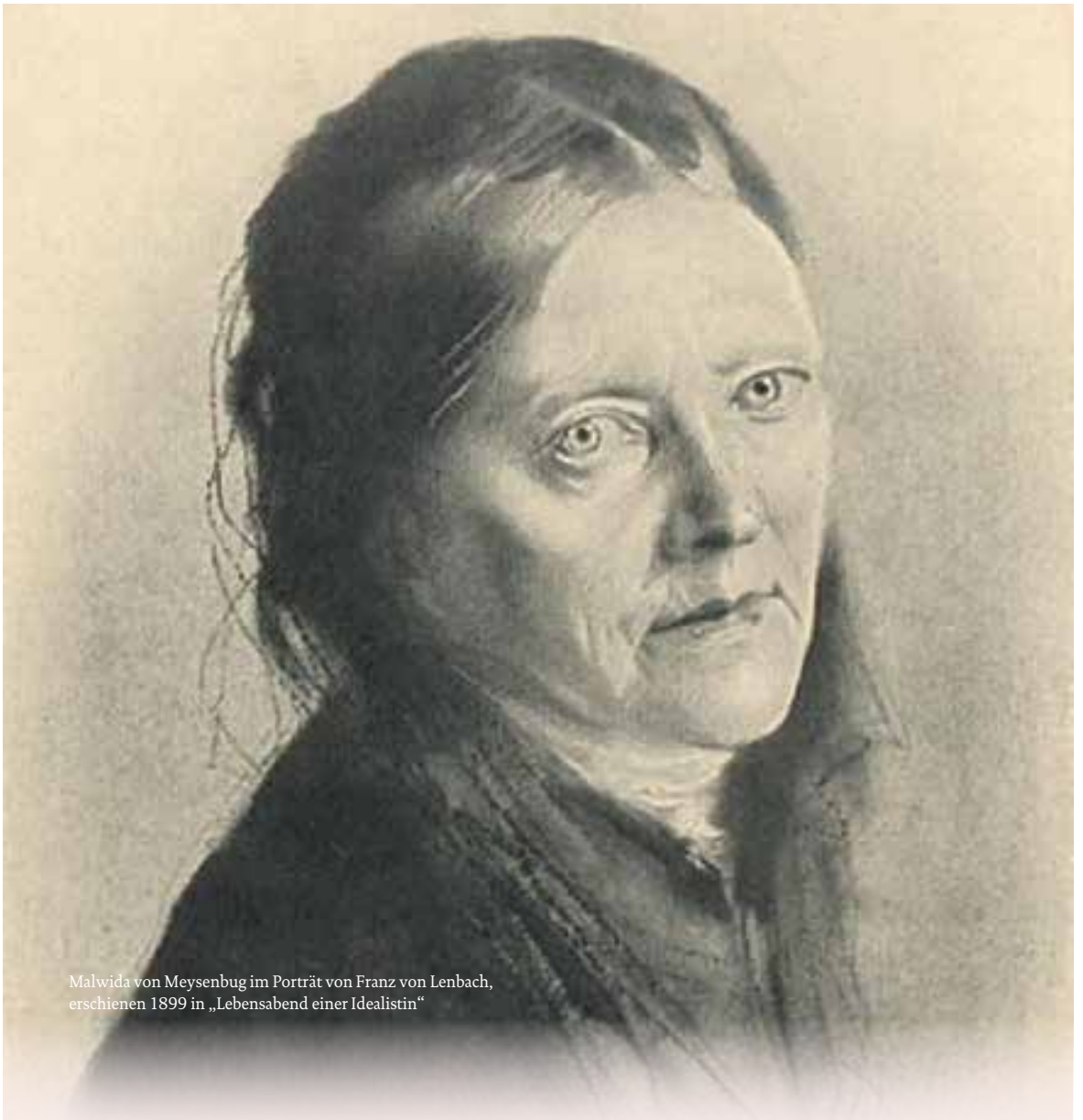
Malwida von Meysenbug im Porträt von Franz von Lenbach, erschienen 1899 in „Lebensabend einer Idealistin“