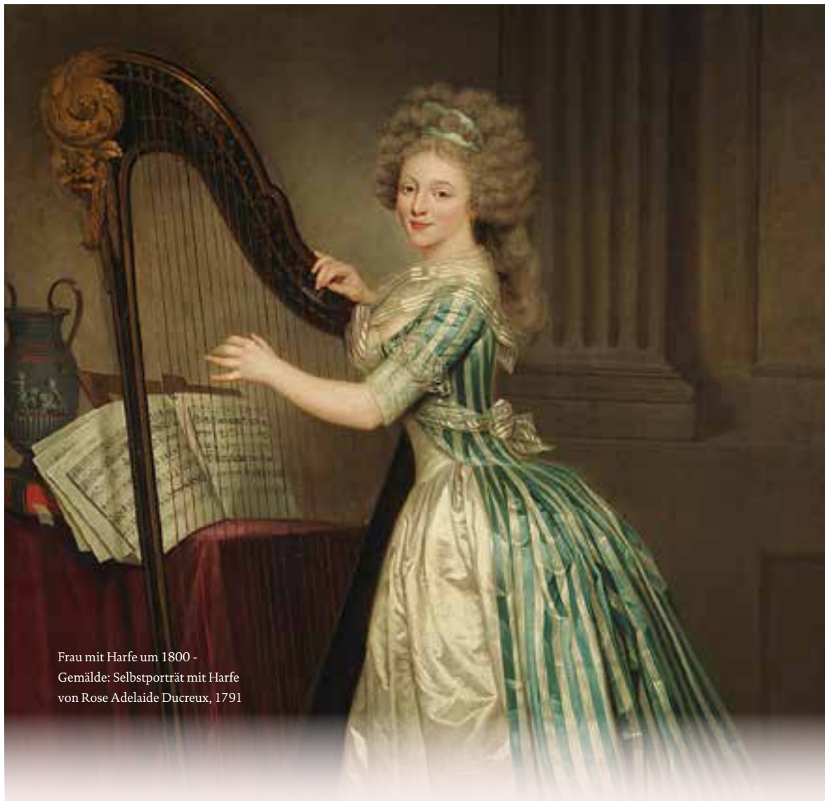
Frau mit Harfe um 1800 - Gemälde: Selbstporträt mit Harfe von Rose Adelaïde Ducreux, 1791