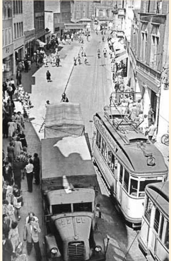
Die Große Straße mit Straßenbahnbetrieb mauserte sich langsam wieder zur Einkaufsader Osnabrücks.

Ihre Eltern packten das Leben nach dem Krieg neu an und verdrängten die schrecklichen Erlebnisse. Das Wirtschaftswunder schien in ihre Köpfe einzuziehen ebenso wie Tütensuppen und Nierentische in Wohnungen und Häuser. Die 50er-Jahre läuteten ein neues Lebensgefühl ein. Junge Mädchen nähten sich zum Tanztee in der Blumenhalle Petticoats mit Reifen im Saum und schwärmten für James