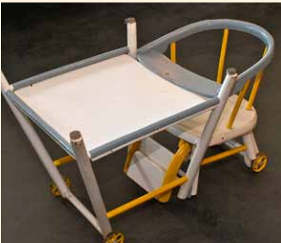
Der Kinderstuhl konnte mit ein paar Handgriffen zu einem Spieltischchen umgebaut werden.