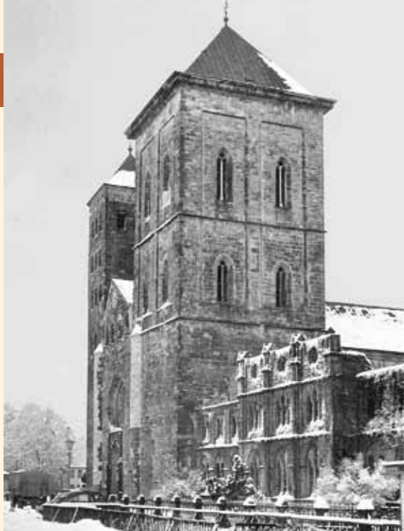
Im Zuge des Wiederaufbaus erhielten die Domtürme pyramidenförmige Dächer.

Als die Lüstringer sich ausmalten, was passieren würde, wenn man im Hauskeller verschüttet würde, beschlossen sie, sich ihren