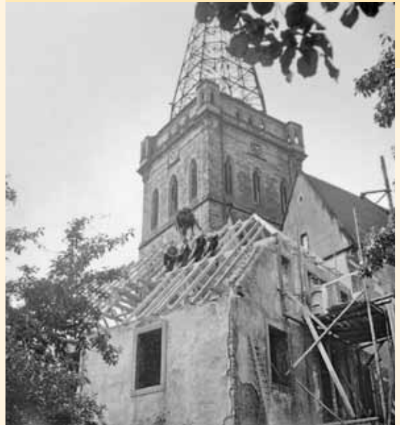
Das Skelett des Kirchturms von St. Katharinen, der spätgotischen Hallenkirche, erinnerte bis weit in die 50er-Jahre an die Zerstörung der Stadt.