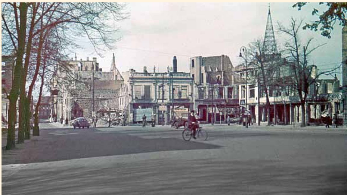
Den Neumarkt säumten 1945 nur mehr Brandruinen und fensterlose Fassaden ohne Dächer.

eigenen Bunker zu bauen. In einem nahe gelegenen Steinbruch buddelten sie mit Spitzhacken und Schaufeln in die aufgeschütteten