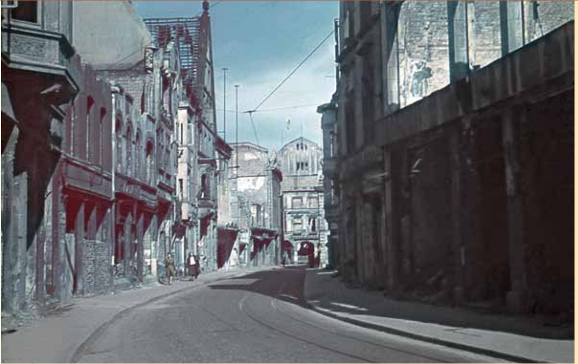
Die Große Straße, das Einkaufsherz der Stadt, bestand aus Ruinen und Dachgerippen.

und den Güterbahnhof in Fledder aus unmittelbarer Nähe. Die Kleine kauerte in einem Erdloch, das als Bunker diente, und glaubte, dass sie sicher bald alle sterben würden.