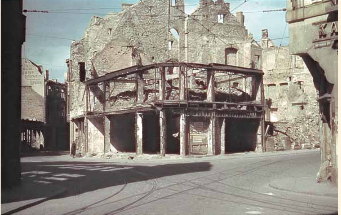
Wo einst florierende Geschäftshäuser die Menschen zum Nikolaiort lockten, zeugten 1945 die Trümmerhäuser von den verheerenden Bombenangriffen auf die Stadt.

Steinberge einen Stollen, der etwa 100 Personen Schutz bot. Er war gerade so hoch, dass die Männer sich an der Lampe den Kopf nicht stoßen konnten.