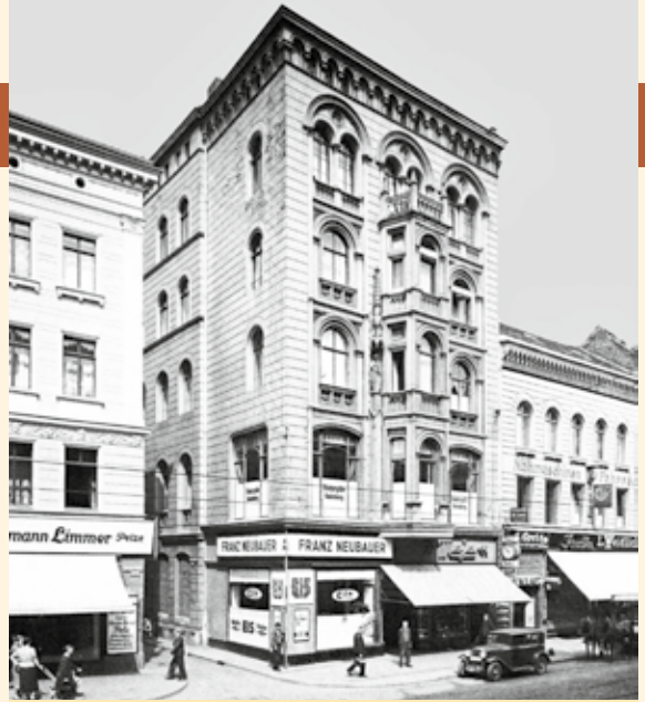
Das Eckhaus Dreienelstraße 1 /Breiter Weg vor der Zerstörung.