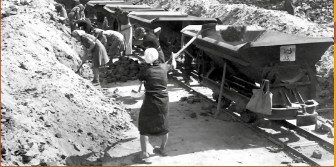
Frauen entrümmern die Altstadt.