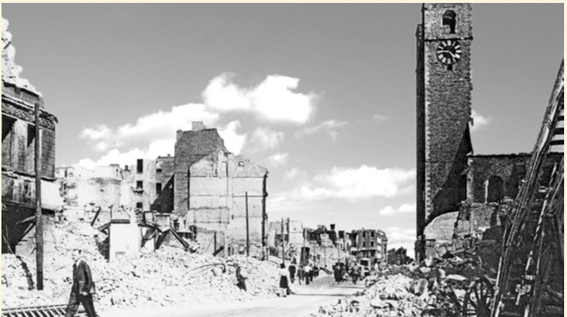
Der Breite Weg nach dem 16. Januar 1945. Das Eckhaus Dreienelstraße befand sich etwa in der Bildmitte links.

Altstädtische Krankenhaus. Wenige Tage später waren Mutter und Sohn wieder vereint. Sie wurden nach Zerbst gebracht. Dort erlebten sie im April die Zerstörung der anhaltischen Residenzstadt und kurz darauf deren Befreiung durch amerikanische Truppen.