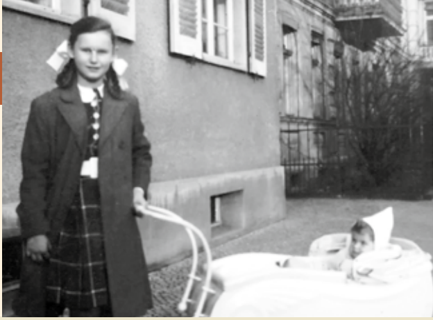
Kinderwagen- und Baby-mode der 40er- und 50er-Jahre.