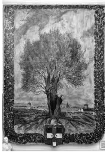
Die Weide, Symbol der Wieden

urkunde vom 27. Mai 1211 wurde der Name „widem“ erstmals erwähnt. So versteht es sich von selbst, dass die Wieden als frühest genannte Vorstadt und damit zweitältester Bezirk nach der Inneren Stadt zur Namensgeberin für den vierten Wiener Bezirk geworden ist. Wen stört es, dass die schöne Weide als Symbol der Wieden trotz der fälschlichen Interpretation weiterhin dem Wappen erhalten blieb und die Wieden am 27. Mai 2011 ihr 800-jähriges Bestehen feierte – selbst wenn die Eingemeindung erst 1850 erfolgte?