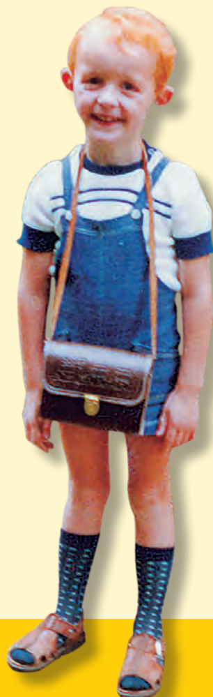
Kindergarten, ich komme

Das Wichtigste am Kindergarten war die Kindertasche. In der Tasche das liebevoll geschmierte Butterbrot, wurde sie im Kindergarten an Haken gehängt, die da in langen Reihen auf uns warteten. Wir hatten jeder unseren eigenen Haken, meist in Form eines Tieres. Alles musste seine Ordnung haben, bevor mit dem gemeinsamen Singen, Spielen, Bauen, Malen unsere Sozialkompetenzen eine Förderung erfuhren. Wir hatten ja keine Ahnung – und die meisten unserer Eltern verfolgten es mit Abscheu – was sich auf diesem Sektor seinerzeit gerade in Berlin tat. In zwölf „antiautoritären Kinderläden“ wurden ab 1969 die Kleinsten ohne Zwang erzogen. Sie durften, wovon wir nicht einmal zu träumen wagten: auf Tische klettern, Wände bemalen, mit Händen essen und Eltern die Zunge herausstrecken. Es waren die unartigsten Kinder der Nation, und sie kamen ohne Bestrafung davon. Deren Eltern nannten das „Erziehungsmethode mit Zukunft“, unsere nannten das „Kappes“, und meinten damit nicht den Weißkohl.