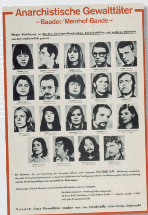
Die Fahndungsbilder von Terroristen wurden alltäglich

Nach dem Vorbild südamerikanischer Widerstandskämpfer verstand sich die RAF als kommunistische „Stadtguerilla“. Aus dem Untergrund heraus nahmen die Mitglieder einen bewaffneten Kampf gegen das „System“ auf, um auch Deutschland vom kapitalistischen Staat und dem „US-Imperialismus“ zu befreien. Feige Anschläge und brutale Entführungen mit 34 Toten und zahlreichen Verletzten pflasterten den Weg ihres internationalen Befreiungskampfes. Die als Baader-Meinhof-Bande in Erinnerung gebliebene RAF erklärte im April 1998 ihre Selbstauflösung: „Heute beenden wir dieses Projekt. Die Stadtguerilla in Form der RAF ist nun Geschichte.“