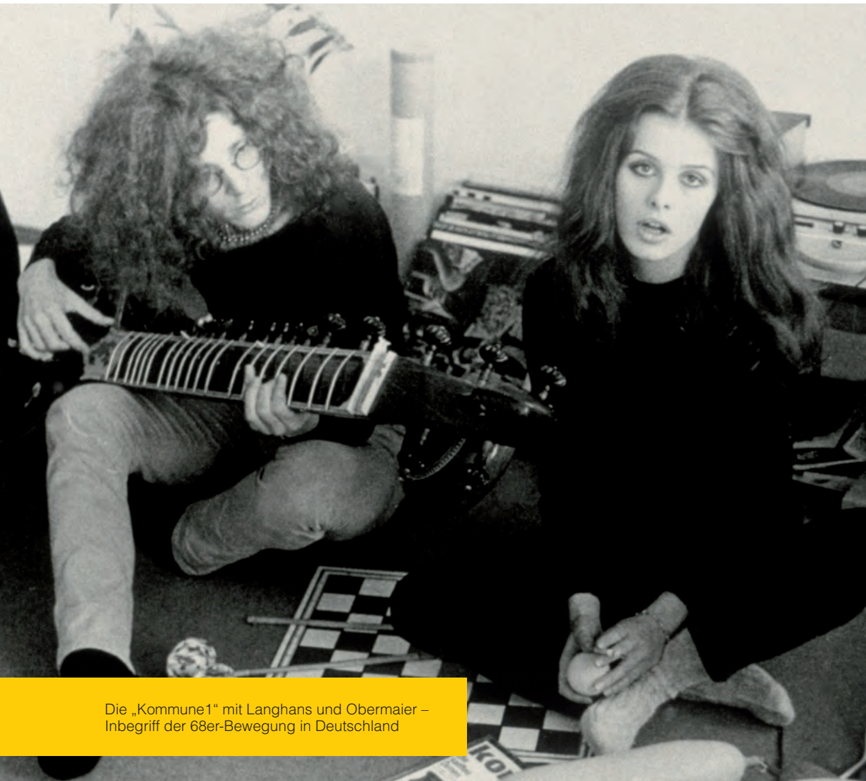
Die „Kommune1“ mit Langhans und Obermaier – Inbegriff der 68er-Bewegung in Deutschland