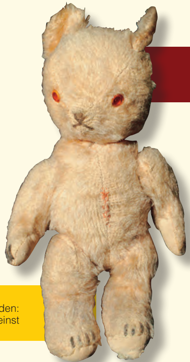
Auch nicht spurlos älter geworden: der Lieblingstедdy von einst

der modernen Sportkarre. Da unsere Mütter stets auf dem neuesten Stand waren, wenn es um zweckmäßige Dinge ging, verschwanden die klobigen Kinderwagen bald von den Spazierwegen. Wir wurden in praktische Frotteestrampler gesteckt, mit hygienisch unbedenklichen Plastikrasseln versorgt und in der Küche wurde sterilisiert, was das Zeug hielt. Immer brodelte irgendein Kochtopf, in dem Schnuller, Nuckel oder Spielzeug schwammen – und im Hintergrund sang Frank Sinatra seinen neuesten Hit: „Strangers in the night“.