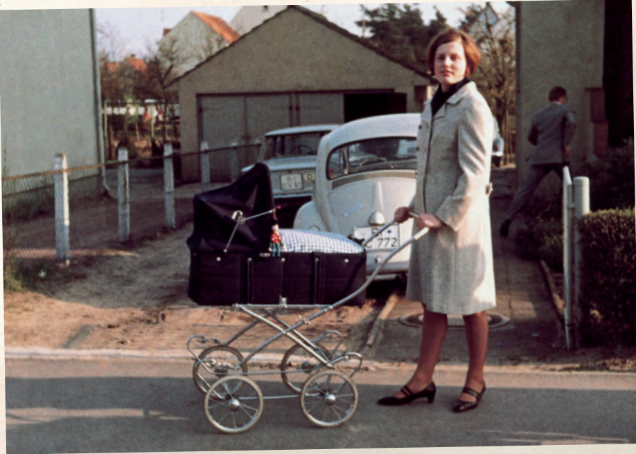
Frische Luft war wichtig: Spazierfahrt im sportlichen Kinderwagen

der modernen Sportkarre. Da unsere Mütter stets auf dem neuesten Stand waren, wenn es um zweckmäßige Dinge ging, verschwanden die klobigen Kinderwagen bald von den Spazierwegen. Wir wurden in praktische Frotteestrampler gesteckt, mit hygienisch unbedenklichen Plastikrasseln versorgt und in der Küche wurde sterilisiert, was das Zeug hielt. Immer brodelte irgendein Kochtopf, in dem Schnuller, Nuckel oder Spielzeug schwammen – und im Hintergrund sang Frank Sinatra seinen neuesten Hit: „Strangers in the night“.