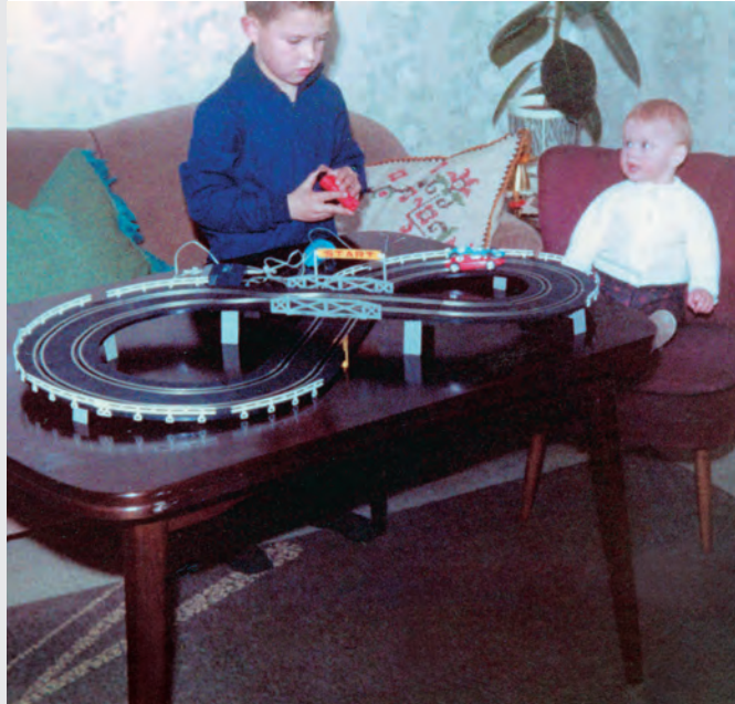
Die erste elektrische Autorennbahn: Und wir durften nur zuschauen