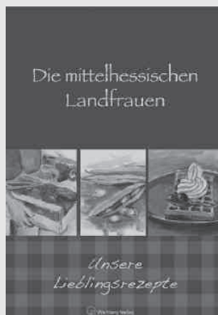
Die mittelhessischen Landfrauen Unsere Lieblingsrezepte Hardcover, 96 Seiten ISBN 978-3-8313-2439-2