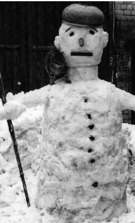
Der Schneemann – unser Begleiter durch die Winterzeit.

In der kälteren Jahreszeit saß die Familie in der Abenddämmerung am heizenden Ofen. Die Großmutter erzählte