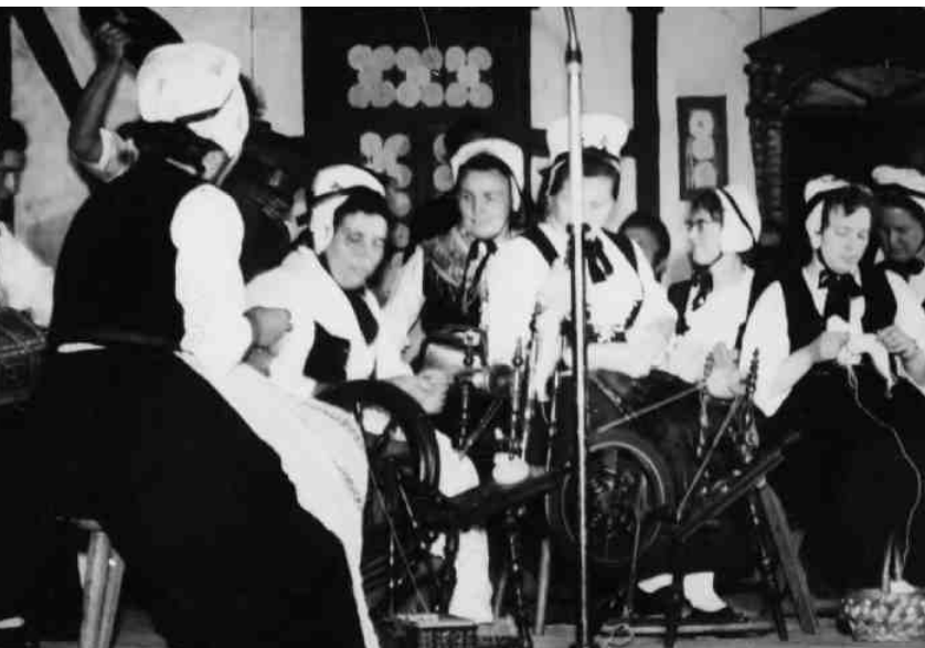
Die Spinnstubenfrauen in ihrer schönen Tracht in voller Aktion.

So mancher Schabernack muss sich wohl in den Dörfern abgespielt haben, denn 1812 kam eine Verordnung heraus,